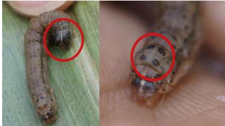
Gambar 4. Morfologi S. frugiperda (CABI, 2019)

Pupa Larva instar 6 yang berwarna coklat tua selanjutnya akan menjadi kurang aktif dan tidak bergerak, hal ini karena larva telah mencapai perkembangan maksimum dan memasuki fase pra pupa. Larva akan terjatuh ketanah dan masuk untuk berkembang menjadi pupa, namun larva bisa memasuki fase pupa dalam keadaan tanpa tanah dan mengikat partikel-partikel yang ada disekitarnya dengan sutra (Nurfauziah, 2020). Panjang pupa lebih pendek dibandingkan larva instar 6 dengan panjang 1,3- 1,5 cm pada jantan dan 1,6-1,7 cm pada betina, dan berwarna coklat mengkilap. Perkembangan pupa dapat berlangsung selama 12-14 hari (Nadrawati dkk., 2019).