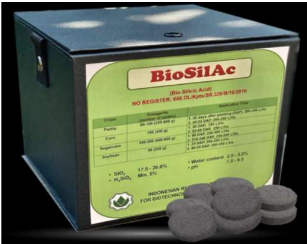
Gambar 8. Silika SiO 2 Padat