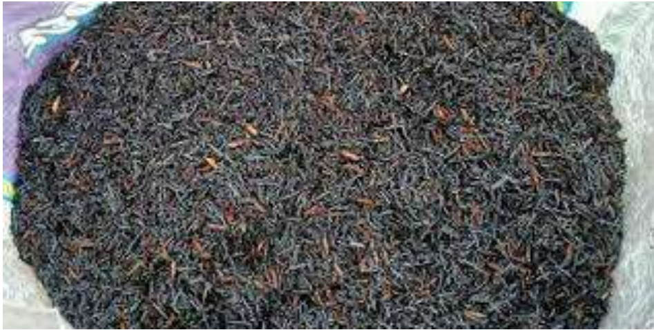
Gambar 9. Sekam Padi Bakar

Abu sekam padi hasil pembakaran yang terkontrol pada suhu tinggi (500-600oC) akan menghasilkan abu silika yang dapat dimanfaatkan untuk berbagai proses kimia (Putro, 2007). Houston (1972) mengatakan bahwa abu sekam padi mengandung silika sebanyak 86%-97% berat kering, dan Mittal (1997) mengatakan abu sekam padi mengandung silika sebanyak 90-98% berat kering.