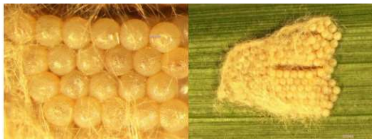
Gambar 2. Kelompok telur S. frugiperda (BBPOPT, 2020)

Ngengat betina S. frugiperda meletakkan telur pada permukaan atau bawah daun jagung. Telur dari S. frugiperda memiliki bentuk bulat dengan warna kuning kecoklatan, dengan ukuran 0,475mm. Kisaran waktu untuk telur menetas adalah 1-2 hari dengan suhu rata-rata 27,55 oC dan kelembaban udara (RH) rata-rata 54%. Telur yang akan menetas akan berwarna kehitaman yang menandakan embrio telah matang (Nurfauziyah, 2020). Telur diletakkan secara kelompok yang berkisar 200-10 300 telur yang diletakkan dalam dua hingga empat lapisan (Nadrawati, dkk, 2019).