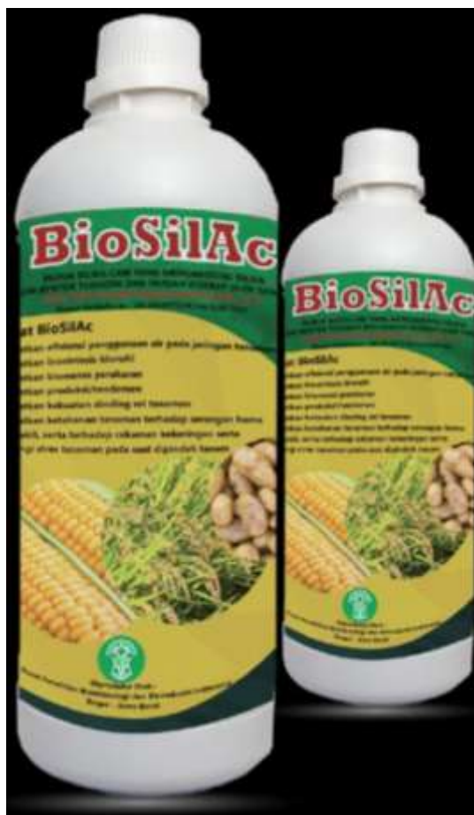
Gambar 7. Silika \text{SiO}_2 Cair

Pada tahap awal aplikasi (25 HST), tanaman jagung sedang berada pada fase aktif pertumbuhan vegetatif. Pemberian silika pada fase ini berfungsi memperkuat struktur sel, meningkatkan biosintesis klorofil, dan merangsang pertumbuhan sistem perakaran. Saat aplikasi kedua (40 HST), tanaman mulai memasuki fase pembentukan tongkol, di mana kebutuhan nutrisi dan perlindungan terhadap cekaman biotik maupun abiotik sangat tinggi. BioSilAc bekerja dengan meningkatkan efisiensi penggunaan air dan memperkuat ketahanan dinding sel, sehingga tanaman lebih tahan terhadap kekeringan dan serangan patogen. Aplikasi terakhir pada umur 55 HST membantu tanaman dalam menghadapi fase generatif