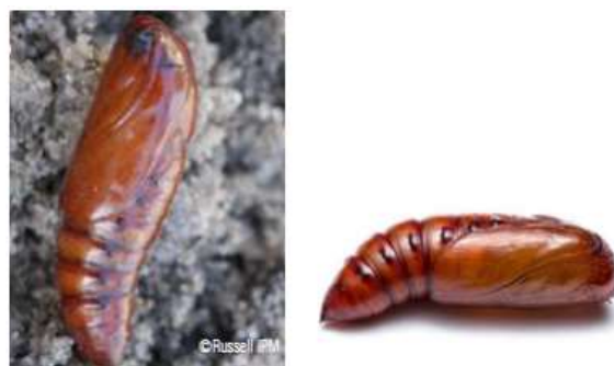
Gambar 5. Pupa S. frugiperda (CABI, 2019)

Pupa Larva instar 6 yang berwarna coklat tua selanjutnya akan menjadi kurang aktif dan tidak bergerak, hal ini karena larva telah mencapai perkembangan maksimum dan memasuki fase pra pupa. Larva akan terjatuh ketanah dan masuk untuk berkembang menjadi pupa, namun larva bisa memasuki fase pupa dalam keadaan tanpa tanah dan mengikat partikel-partikel yang ada disekitarnya dengan sutra (Nurfauziah, 2020). Panjang pupa lebih pendek dibandingkan larva instar 6 dengan panjang 1,3- 1,5 cm pada jantan dan 1,6-1,7 cm pada betina, dan berwarna coklat mengkilap. Perkembangan pupa dapat berlangsung selama 12-14 hari (Nadrawati dkk., 2019).