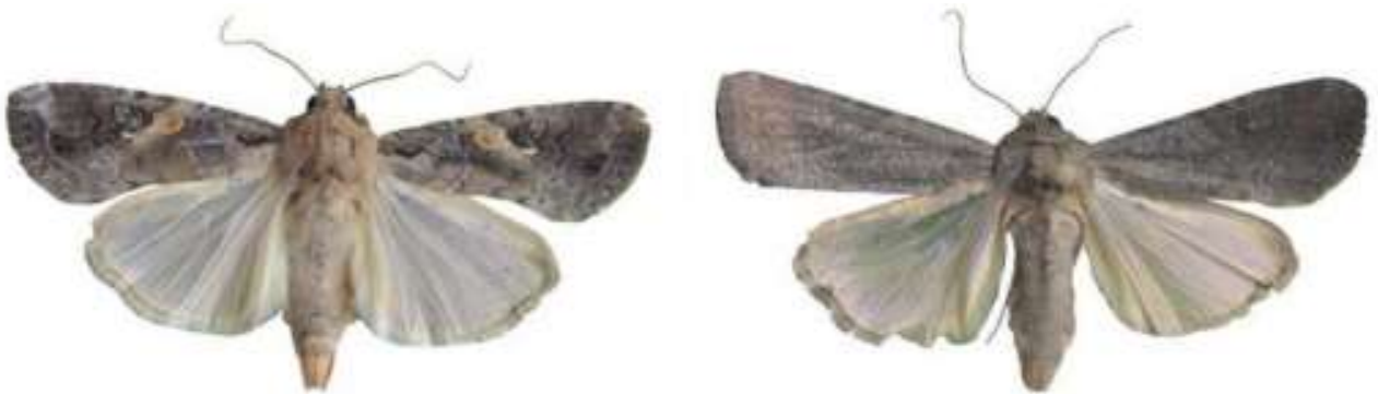
Gambar 6. Imago jantan dan imago betina (Sharanabasappa dkk, 2018)

Perubahan pupa menjadi imago terjadi saat pagi dan sore hari. Saat imago mulai keluar dari pupa sayap dari imago tersebut akan nampak terlipat (Nurfauziah, 2020). Imago S. frugiperda jantan dan betina memiliki perbedaan, Imago jantan memiliki panjang tubuh 1,6 cm dan lebar sayap 3,7 cm dengan sayap depan memiliki bercak berwarna coklat pada tiga perempat area dan berwarna abu-abu pada seperempat area sayap serta memiliki spot berbentuk oval. Sedangkan pada Imago betina memiliki panjang tubuh 1,7 cm dan lebar sayap 3,8 cm dengan sayap depan berbintik-bintik berwarna abu-abu dengan margin coklat gelap ( Nadrawati dkk., 2019).