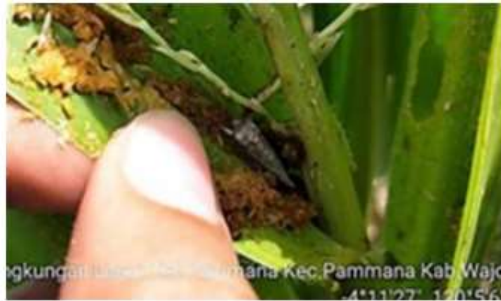
Gambar 1. Tanda serangan S. frugiperda (Rusisah, 2021)

terbang S. frugiperda dalam menempuh jarak sejauh ratusan kilometer dengan bantuan angin bahkan dalam satu malam (Westbrook et.al. , 2016). Berdasarkan hasil penelitian Rusisah (2021), hama S. frugiperda menyerang pertanaman jagung pada umur 1 minggu. Hama ini menyerang mulai fase vegetatif hingga fase generatif. Serangan hama pada fase vegetatif memiliki ciri khas yaitu ditandai dengan adanya serbuk kasar berwarna coklat menyerupai gergaji dan pada fase generatif hama ini menyerang tongkol dan bunga jantan.