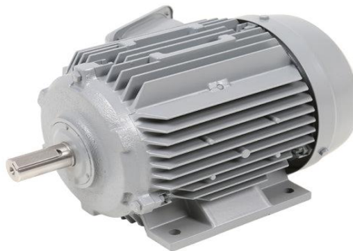
Gambar 2.7 Motor penggerak

Motor penggerak berfungsi sebagai sumber tenaga utama yang menggerakkan impeller. Kebanyakan blower industri menggunakan motor listrik, tetapi beberapa mungkin menggunakan mesin pembakaran internal, terutama untuk aplikasi portabel atau di lokasi tanpa akses listrik. Motor mengkonversi energi listrik atau bahan bakar menjadi energi mekanik untuk memutar poros impeller.