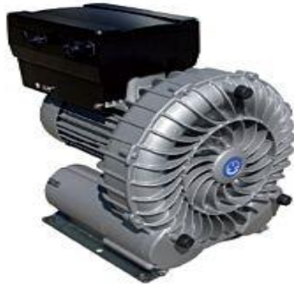
Gambar 2.12 Perangkat kontrol