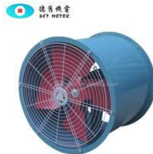
Gambar 2.3 Blower Aksial