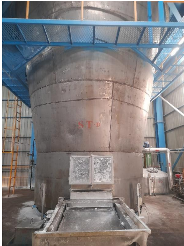
Gambar 2.1 Spray Tower

Spray tower adalah jantung dari proses spray drying , sebuah metode pengeringan di mana bahan cair (larutan, suspensi, atau emulsi) diubah menjadi partikel padat atau bubuk kering. Prinsip dasarnya adalah mengontakkan tetesan kecil material cair dengan aliran udara panas, menyebabkan penguapan cepat pelarut (biasanya air) dan meninggalkan padatan dalam bentuk partikel kering.