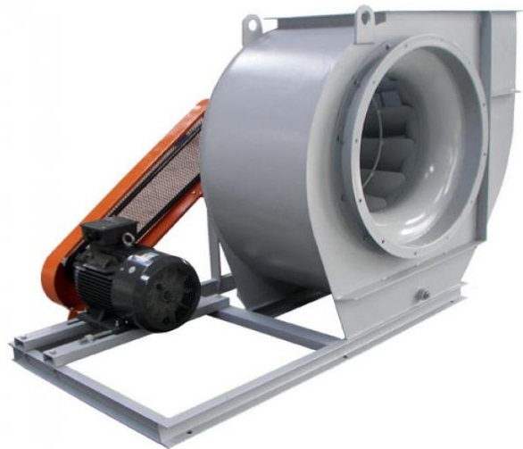
Gambar 2.10 Sistem transmisi Blower

Jika motor tidak terhubung langsung ke poros impeller (direct drive), maka diperlukan sistem transmisi. Ini bisa berupa sabuk dan puli (belt drive) atau gearbox. Fungsinya adalah untuk mengatur kecepatan putaran impeller agar sesuai dengan kecepatan output motor, atau untuk menyesuaikan torsi yang diperlukan.