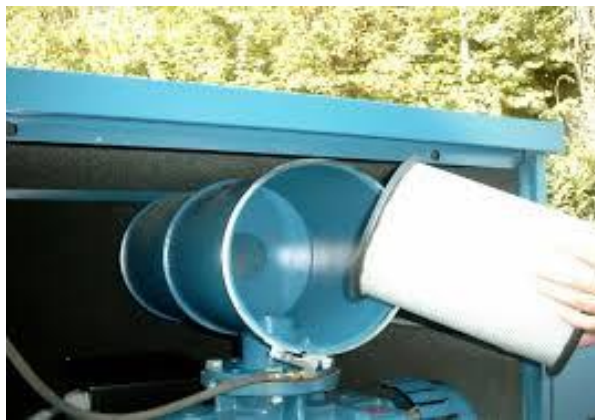
Gambar 2.11 Filter udara Blower

Filter udara adalah komponen opsional namun penting, terutama di lingkungan berdebu. Filter udara dipasang di saluran masuk untuk menyaring partikel-partikel kotoran, debu, atau kontaminan dari udara sebelum masuk ke dalam blower. Ini melindungi impeller dan komponen internal lainnya dari kerusakan abrasif dan menjaga kualitas udara yang dikeluarkan.