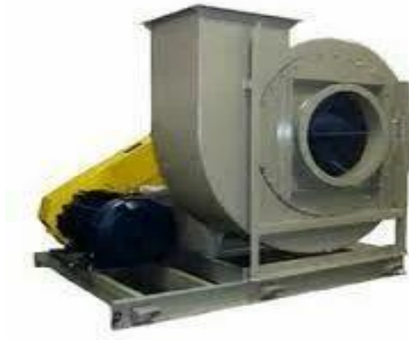
Gambar 2.5 Casing Blower

sentrifugal, casing seringkali berbentuk spiral (volute) untuk mengkonversi kecepatan udara menjadi tekanan.