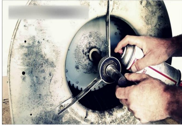
Gambar 2.9 Bantalan ( Bearing )