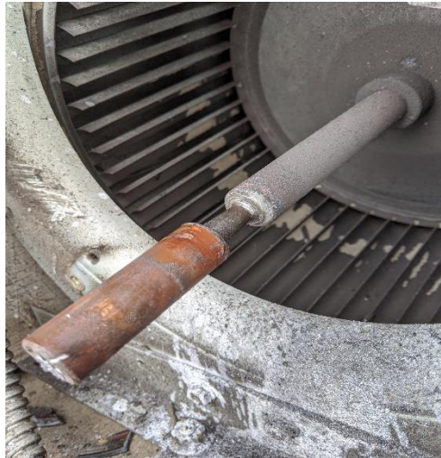
Gambar 2.8 Poros ( shaft ) Blower

Poros ( shaft ) berfungsi sebagai batang yang menghubungkan impeller ke motor penggerak. Poros mentransfer putaran dari motor ke impeller, sehingga impeller dapat berputar.