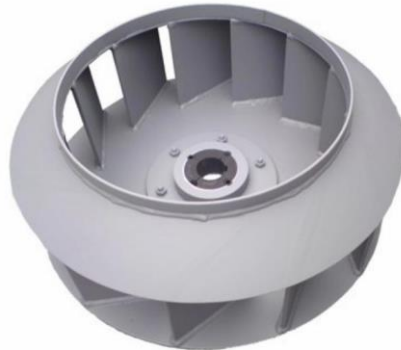
Gambar 2.4 Impeller Blower

Impeller adalah bagian berputar yang dilengkapi dengan bilah-bilah (blades) atau lobus. Fungsinya adalah untuk menangkap udara atau gas dan mentransfer energi kinetik ke dalamnya, sehingga menyebabkan udara bergerak. Pada blower sentrifugal, impeller mendorong udara keluar secara radial, sementara pada blower aksial, ia mendorong udara sejajar dengan poros. Pada positive displacement blower, rotor/lobus menjebak dan memindahkan volume gas.