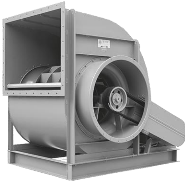
Gambar 2.2 Blower Sentrifugal