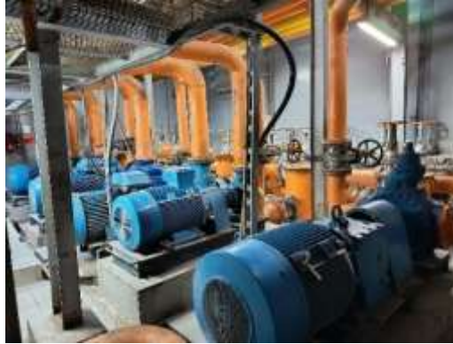
Gambar 2.9 : Jalur pipa dan Katup