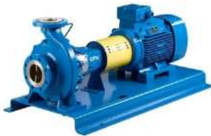
Gambar 2.2 : Jenis Pompa

Fluida masuk ke mata impeller (pusat impeller ) melalui saluran hisap. Impeller yang berputar dengan kecepatan tinggi memberikan gaya sentrifugal pada fluida, "melemparkan" fluida keluar secara radial dari pusat impeller menuju ujung sudu-sudu. Saat fluida bergerak dari mata impeller ke jari-jari yang lebih besar, kecepatan absolutnya meningkat. Fluida bertekanan tinggi ini kemudian keluar melalui saluran discharge , (Cimbala, J. M. 2014)