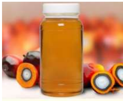
Gambar : 2.1 Karakteristik RBD (Palm Oil)