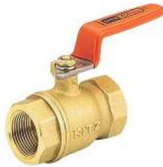
Gambar 2.13 : Ball Valves