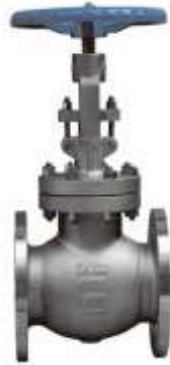
Gambar 2.11 : Globe Valve

Ideal untuk pengaturan aliran ( throttling ) karena desainnya memungkinkan kontrol yang baik atas laju aliran. Namun, mereka memiliki kerugian tekanan yang lebih tinggi dibandingkan gate valves saat terbuka penuh.