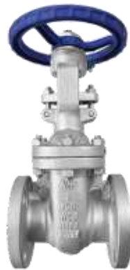
Gambar 2.14 : Shout-off Valves

Katup yang dioperasikan secara otomatis (seringkali pneumatik atau hidrolis) yang dirancang untuk menutup secara cepat dalam keadaan darurat (misalnya, kebocoran, kebakaran) untuk mengisolasi bagian sistem dan mencegah tumpahan besar.