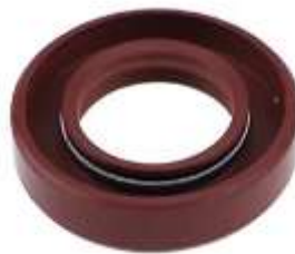
Gambar 2.7 : Seal

Seal adalah komponen kritis yang mencegah kebocoran fluida dari casing pompa di sekitar poros yang berputar dan, sama pentingnya, mencegah udara masuk ke pompa (terutama di sisi hisap, yang dapat menyebabkan kavitasi). Fungsi utamanya adalah mengisolasi fluida di dalam pompa dari lingkungan luar, (Cherkassky, V. N. 1986).