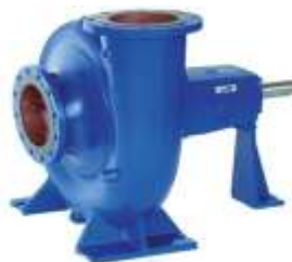
Gambar 2.3 : casing (rumah)

Casing adalah selubung luar pompa yang berfungsi sebagai wadah untuk semua komponen internal yang berputar dan mengarahkan aliran fluida. Fungsi utamanya meliputi pengumpulan fluida yang keluar dari impeller .