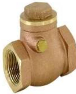
Gambar 2.12 : Check Valve

Mencegah aliran balik fluida dalam pipa. Ini sangat penting di sisi discharge pompa untuk mencegah minyak mengalir kembali ke pompa saat pompa berhenti.