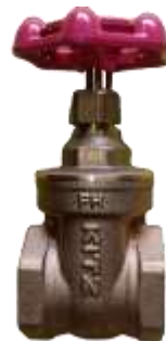
Gambar 2.10 : Gate Valves

Digunakan untuk isolasi penuh (membuka atau menutup penuh aliran). Mereka menawarkan resistansi aliran yang sangat rendah saat terbuka penuh tetapi tidak cocok untuk pengaturan aliran ( throttling ).