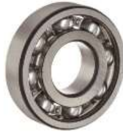
Gambar 2.6 : Bearing