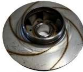
Gambar 2.4 : Impeller

Impeller adalah komponen berputar yang merupakan "jantung" pompa sentrifugal, bertanggung jawab langsung dalam mentransfer energi dari motor ke fluida. Fungsinya adalah menerima fluida di bagian tengah (mata impeller ) dan, melalui putarannya, memberikan gaya sentrifugal pada fluida, mendorongnya keluar secara radial dengan kecepatan tinggi.