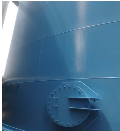
Gambar 2.2 Dinding dan Mainhole Tangki

Dinding tangki, umumnya dibuat dari pelat baja karbon harus menahan tekanan hidrostatik maksimum CPO. Bentuk dari dinding tangki sendiri terlihat pada ( Gambar 2.2 ). Tekanan ini terbesar di bagian bawah tangki. Oleh karena itu, tebal pelat dihitung secara berlapis ( shell plating design ), semakin ke bawah semakin tebal.