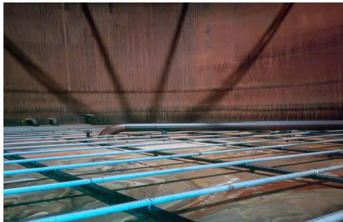
Gambar 2.3 Pipa Heating Coil

Koil pemanas adalah penukar panas ( heat exchanger ) internal yang paling umum digunakan, bentuk dari koil pemanas terlihat pada ( Gambar 2.3 dan 2.4 ). Koil dialiri steam (uap panas) bertekanan rendah, yang merupakan media pemanas paling efisien di Pabrik Kelapa Sawit (PKS).