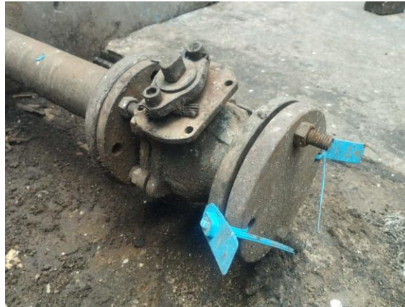
Gambar 2.7 Drain Valve

Efisiensi sistem drainage sangat dipengaruhi oleh desain dasar miring. Drain Valve yang terpasang di titik terendah tangki memungkinkan pengurasan terpisah antara CPO dan M&I, meminimalkan jumlah air reaktan yang tersisa di dalam tangki.