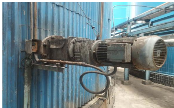
Gambar 2.6 Agitator (Pengaduk)

Agitator (Pengaduk) menciptakan aliran fluida di dalam tangki untuk mencapai homogenitas termal (menghilangkan hot spot) dan mencegah sedimentasi air/kotoran. Dengan mencegah kontak antara CPO dan endapan air/kotoran, agitator secara efektif memperlambat laju kenaikan ALB , yang merupakan indikator keberhasilan penyimpanan. Desain agitator melibatkan perhitungan daya yang dibutuhkan untuk menggerakkan impeller pada viskositas CPO.