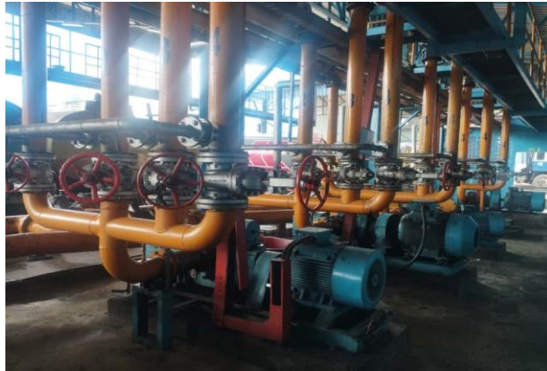
Gambar 2.5 Pompa dan Pemipaan

Pemilihan pompa harus dilakukan dengan cermat, mempertimbangkan sifat non-Newtonian CPO pada suhu operasi. Analisis kehilangan tekanan ( pressure loss ) di sepanjang jalur pipa, termasuk fitting dan katup, sangat penting untuk menentukan daya ( horsepower ) dan head pompa yang dibutuhkan.