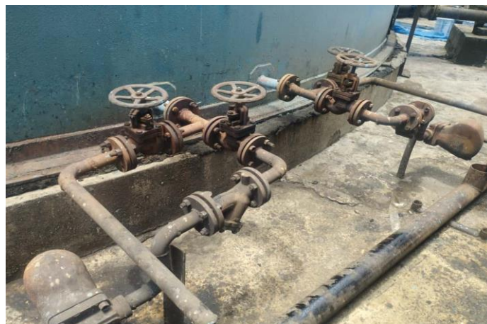
Gambar 2.4 Inlet dan Outlet Heating Coil