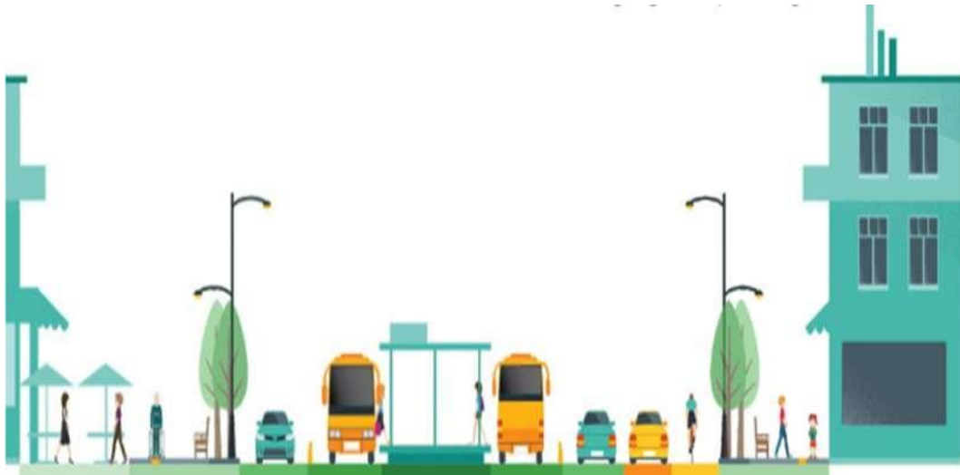
Gambar 2.1 Potongan melintang jalan ideal dalam kota

berbeda-beda. Perbedaan-perbedaan tersebut masih di pengaruhi oleh keadaan fisik dan psikologi, umur serta jenis kelamin dan pengaruh-pengaruh luar seperti cuaca, penerangan/lampu jalan dan tata ruang. Penyediaan fasilitas pejalan kaki dan pesepeda merupakan hal yang tidak terpisahkan dari konsep Complete Street, yaitu jalan yang dapat diakses dan digunakan semua pengguna, usia, dan kemampuan. Seperti penjelasan pada