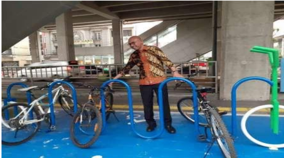
Gambar 2.9 Tempat Istirahat / Halte Sepeda