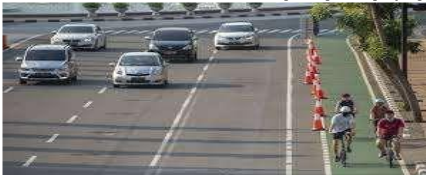
Gambar 2.4 Jalur Sepeda di Badan Jalan (Tipe C)