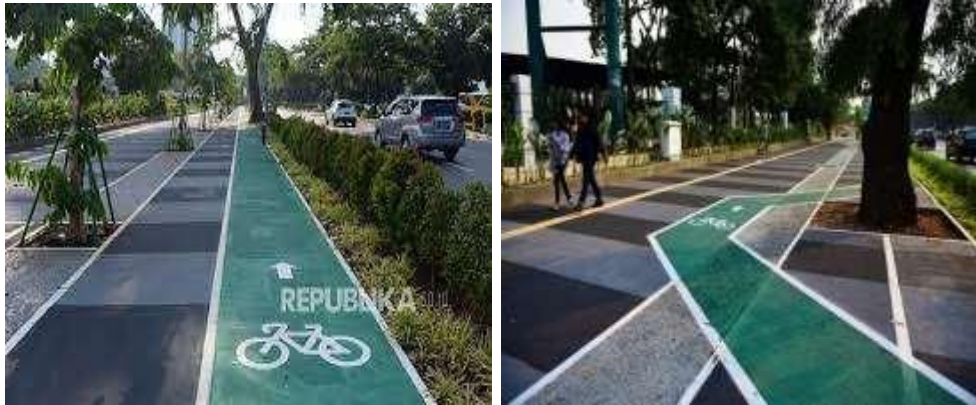
Gambar 2.3 Penempatan Jalur Sepeda Tipe B Pada Trotoar Senayan Jakarta