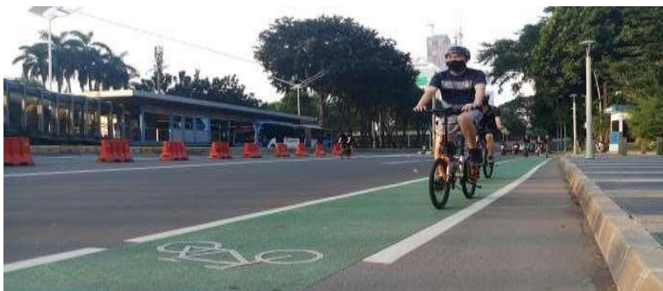
Gambar 2.2 Jalur Sepeda Di Badan Jalan (Tipe A)