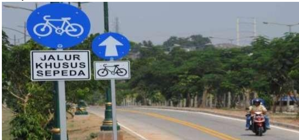
Gambar 2.7 Rambu Jalur Khusus Sepeda