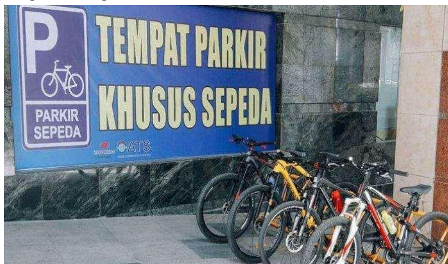
Gambar 2.8 Parkir Sepeda