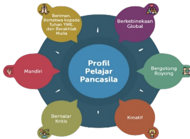
Gambar 2.1 Profil Pelajar Pancasila

Profil Pelajar Pancasila memiliki beragam kompetensi yang dirumuskan menjadi enam dimensi kunci. Keenamnya saling berkaitan dan menguatkan sehingga upaya mewujudkan Program Penguatan Profil Pelajar Pancasila (P5) yang utuh membutuhkan berkembangnya seluruh indikator tersebut secara bersamaan. 6 Dimensi tersebut adalah: