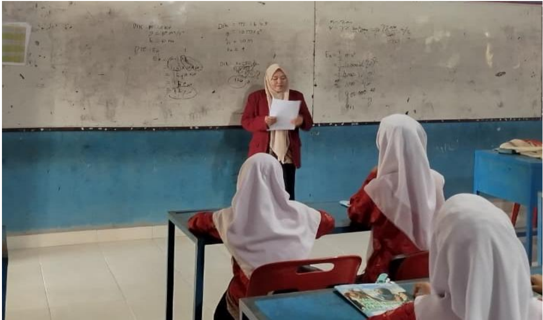
Penyebaran Angket Kepada Siswa Kelas VIII