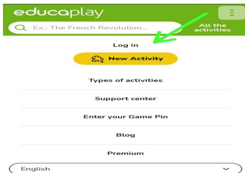
Gambar 2. 1 gambar membuat akun educaplay

Akses situs educaplay dengan membuka browser web dan akses situs resmi educaplay di http://www.educaplay.com/ . klik “daftar akun” dan temukan opsi “daftar” atau “sign up” yang terdapat di halaman utama educaplay . Setelah itu isi formulir pendaftaran dengan mengisi informasi yang diperlukan, seperti nama, alamat email, serta kata sandi. Ikuti arah yang diberikan.