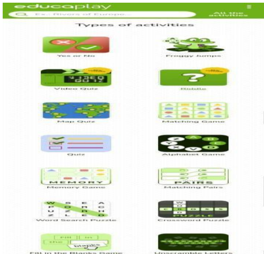
Gambar 2. 3 Tampilan Untuk Membuat Dan Memilih Permainan Sebagai Media Pembelajaran