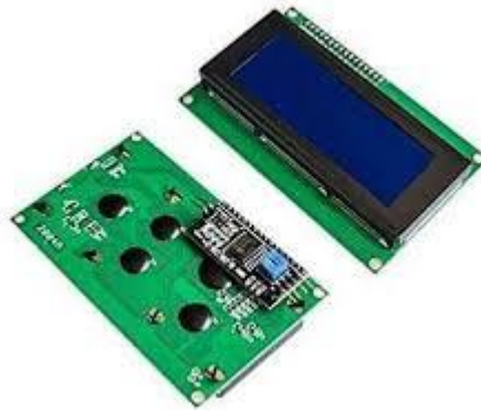
Gambar 2.3 LCD 4x20 Sebagai Antarmuka

LCD (Liquid Crystal Display) 4x20 adalah modul tampilan yang terdiri dari 4 baris dan 20 kolom karakter, sehingga mampu menampilkan hingga 80 karakter sekaligus. Modul ini digunakan untuk menampilkan informasi teks seperti status sistem, ID kartu, atau pesan tertentu.