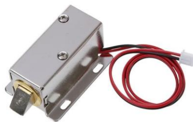
Gambar 2.4 Solenoid Door Lock 12v

Solenoid doorlock merupakan aktuator elektromekanis yang digunakan untuk membuka atau mengunci pintu secara otomatis. Saat diberikan tegangan 12V DC, kumparan di dalam solenoid akan menarik tuas pengunci, memungkinkan pintu terbuka.