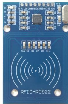
Gambar 2.1 RFID-RC522

RFID ( Radio Frequency Identification ) adalah teknologi identifikasi tanpa kontak ( contactless ) yang menggunakan gelombang radio untuk membaca informasi dari tag RFID. Salah satu jenis modul RFID yang banyak digunakan adalah RC522, yang bekerja pada frekuensi 13.56 MHz dan kompatibel dengan berbagai mikrokontroler .