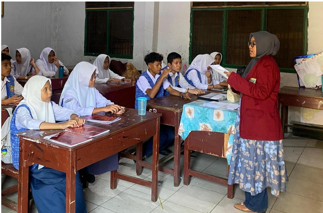
Penyebaran Angket di SMP Swasta Darul Aman Medan