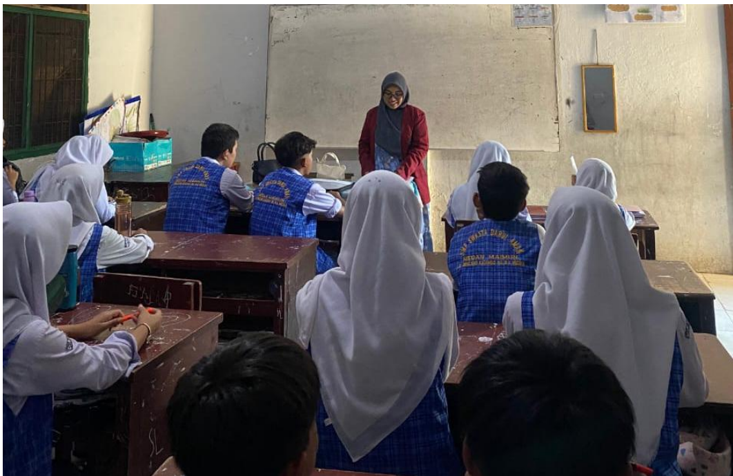
Siswa Mulai Menjawab Angket yang Telah disebar