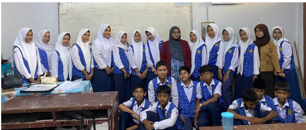
Foto Bersama Siswa Kelas VIII SMP Swasta Darul Aman Medan