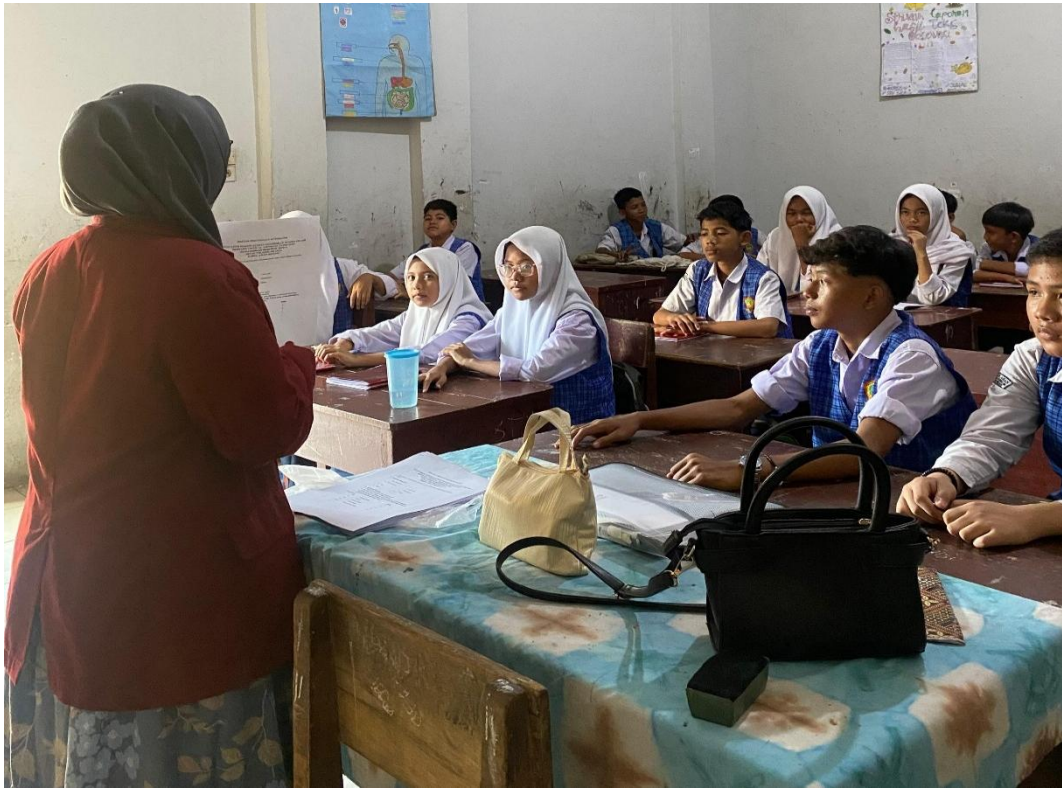
Menjelaskan Angket Sebelum diSebar Kepada Siswa