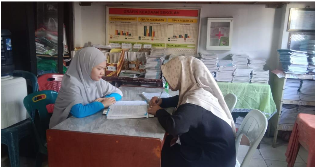
Wawancara Dengan Guru PAI SMP Swasta Darul Aman Medan