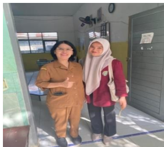
Poto Bersama Guru Matematika