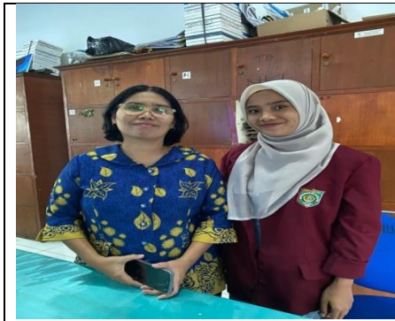
Observasi dan Wawancara dengan Guru Matematika kelas VII