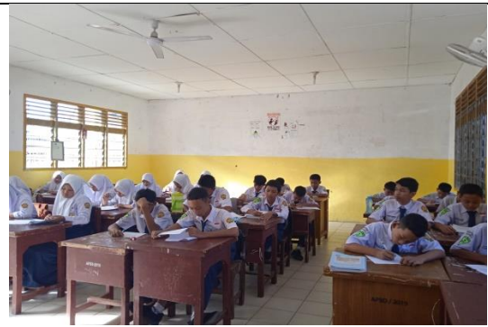
Pengerjaan soal pre-test