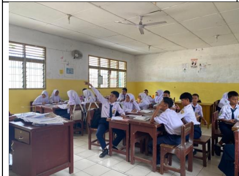
Pembelajaran berbasis masalah