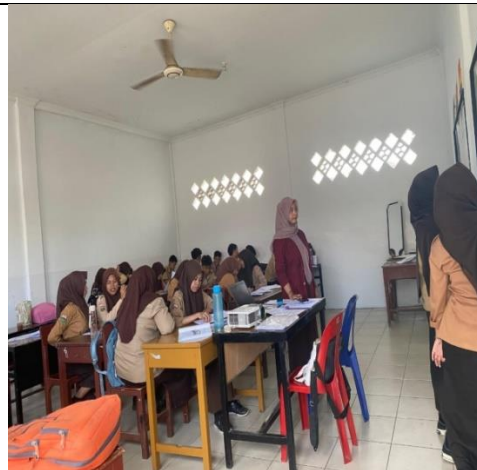
Pelaksanaan perlakuan model pembelajaran think pair share