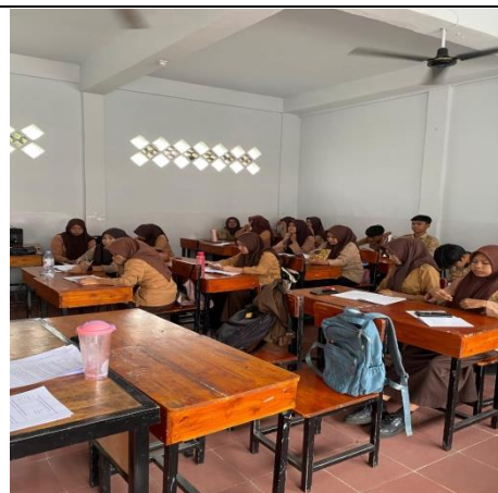
Pelaksanaan kegiatan post-test