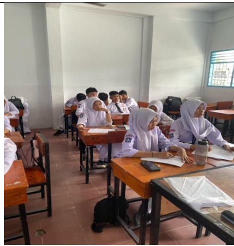
Pelaksanaan kegiatan pre-test