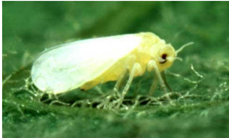
Gambar 2. Imago Kutu kebul ( B.tabaci Genn)

Kutu kebul Bemisia tabaci merupakan hama penting pada tanaman cabai merah. Hama ini pertama kali ditemukan di Indonesia pada tahun 1938 pada tanaman tembakau (Kalshoven 1981). Permasalahan hama B. tabaci tidak terbatas hanya di kawasan Indonesia saja, karena hama ini juga menyerang berbagai tanaman di beberapa negara lain seperti Australia, India, Sudan, Iran, El Salvador, Mexico, Brazil, Turki, Israel, Thailand, Arizona, California, Eropa, Jepang, dan USA. Perkembangbiakan dan penyebaran hama tersebut sangat cepat, dalam kurun waktu 1 tahun, hama tersebut dapat menghasilkan 15 generasi (Gambar 1) (Liu et all 2012)