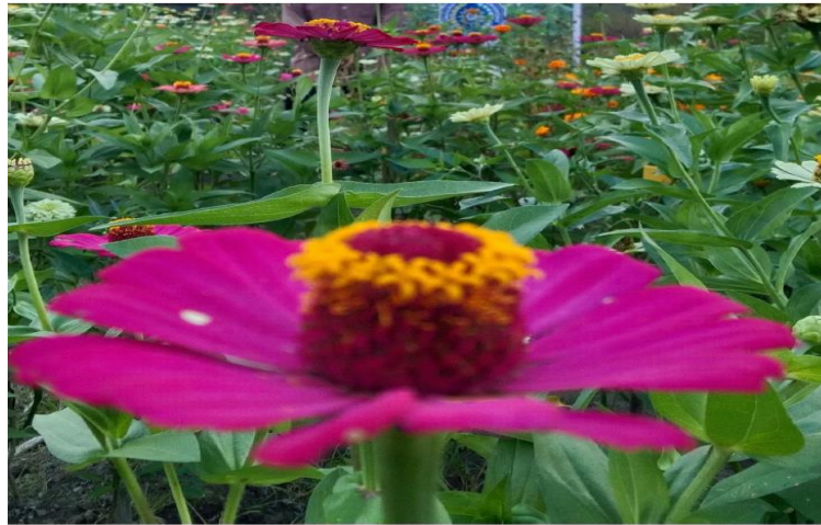
Gambar 4. Zinnia sp

Hasil penelitian Sejati (2010) menunjukkan bahwa semua tanaman berbunga yaitu bunga kenop/kancing, bunga kertas ( Z. elegans ), bunga jengger ayam, bunga soka dapat mendatangkan serangga yang bermacam-macam jenisnya, ada yang sebagai musuh alami, hama, dan serangga lainnya. Penggunaan tanaman yang paling efektif adalah bunga jengger ayam dan bunga kertas ( Z. elegans ). Bunga kertas dikunjungi sebanyak 91 ekor dan 4 ekor Arachnida selama 14 kali pengamatan, dan yang terbanyak dari family Formicidae 42,8% dan paling sedikit adalah dari family Acrididae yaitu sebanyak 1,1%.