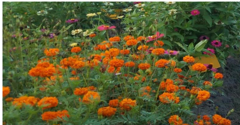
Gambar 5. Tagetes erecta

Hasil penelitian Erdiansyah et al (2018) menyatakan bahwa pemanfaatan tanaman refugia dengan masa berbunga lebih panjang akan mempengaruhi populasi arthropoda menggunakan tanaman refugia. Pemanfaatan tanaman refugia bunga marigold dan kacang hias berpengaruh terhadap jumlah anakan produktif pada petak tanaman padi dengan perlakuan refugia. Namun tidak berpengaruh pada petak tanaman padi tanpa refugia. Pemanfaatan tanaman refugia bunga marigold dan kacang hias berpengaruh terhadap populasi musuh alami belalang bertanduk panjang antara petak tanaman padi dengan perlakuan refugia kacang