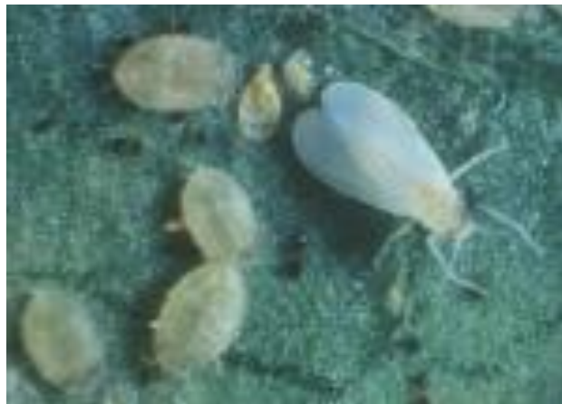
Gambar 3. Nimfa dari Hama kutu kebul ( B.tabaci Genn)

Nimfa B. tabaci terdiri dari tiga instar dan instar ke-4 dianggap sebagai transisi dan dinamakan instar ke-4 atau pupa karena peralihan antara dua stadia yang singkat dan sulit untuk dipisahkan. Nimfa instar ke-4 biasanya dikenal sebagai pupa. Nimfa instar satu (panjang + 0,223 mm, lebar + 0,131 mm) berbentuk bulat panjang, berwarna hijau cerah, pada pinggir tubuhnya terdapat bulu bulu halus dan lapisan lilin yang tipis. Nimfa instar 1 yang baru keluar dari telur aktif bergerak dan mengisap cairan makanan pada permukaan bawah daun selama 1-2 hari, dan setelah mendapatkan tempat yang sesuai akan menetap dan tidak bergerak lagi. Nimfa instar 2 (panjang \pm 0,283 mm, lebar \pm 0,178 mm), nimfa instar 3 (panjang \pm 0,470 mm, lebar \pm 0,312 mm) dan nimfa instar 4 tidak bergerak, berwarna hijau gelap, tungkai tereduksi, pada bagian dorsal terdapat tiga pasang duri (Ahsol et all , 2016) (Gambar 2).