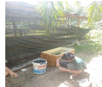
a) Persiapan bahan-bahan pembuatan MOL