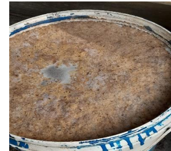
b) Pencampuran semua bahan pada satu wadah kemudian ditutup