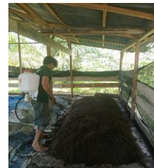
e) Penumpukan dan penyemprotan MOL pada bahan-bahan pembuatan kompos