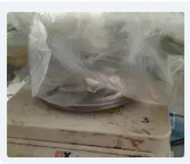
Bobot brangkasan kering