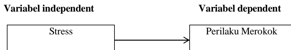
Gambar 2 3 Kerangka Konsep

Kerangka konsep adalah kerangka hubungan antara konsep-konsep yang ingin diamati atau diukur melalui penelitian-penelitian yang akan dilakukan (Notoatmodjo, 2012). Adapun kerangka konsep yang dibuat berdasarkan tujuan penelitian yaitu: