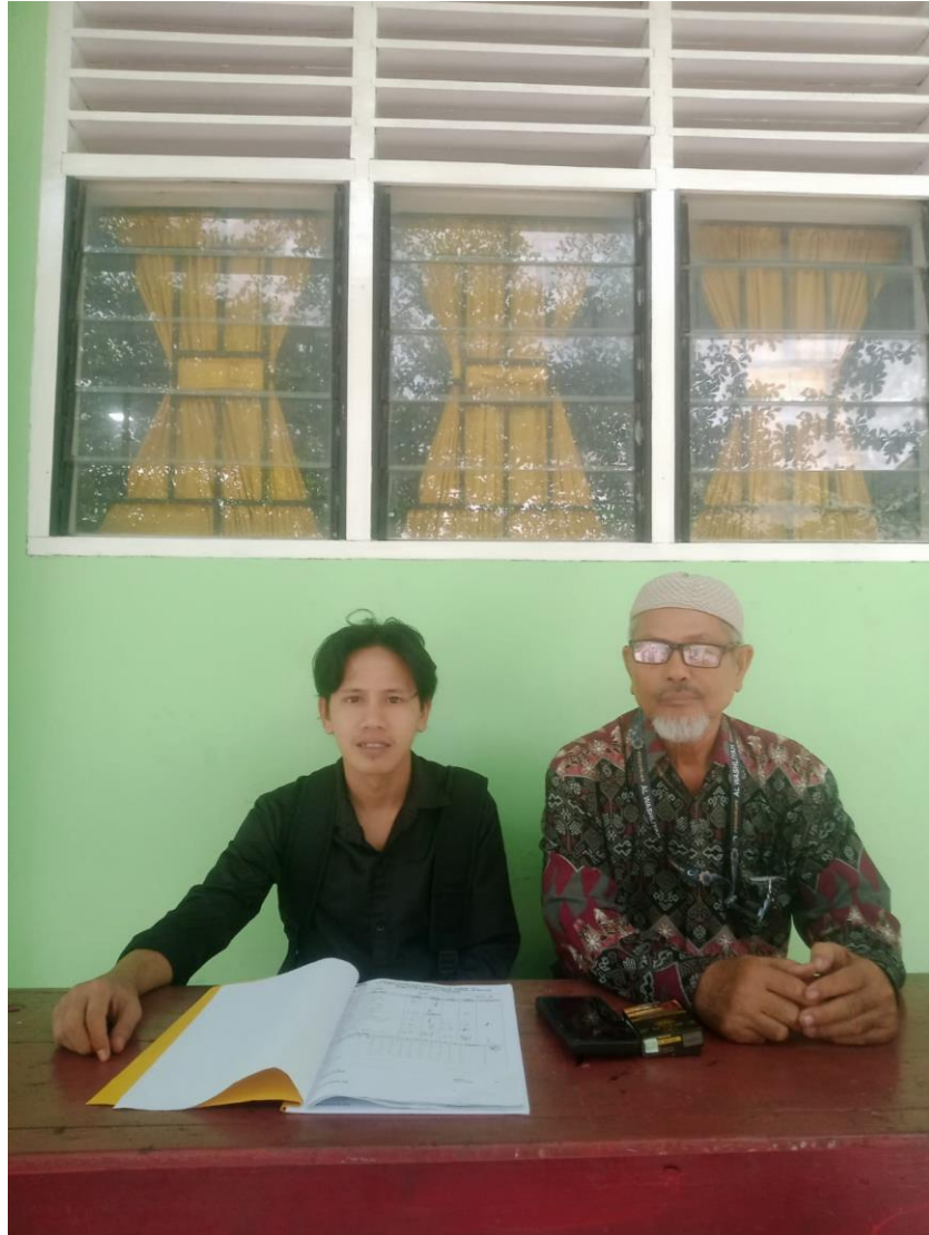
Foto bersama Kepala Sekolah Qismul Ali Al-Jam'Iyatul Washliyah