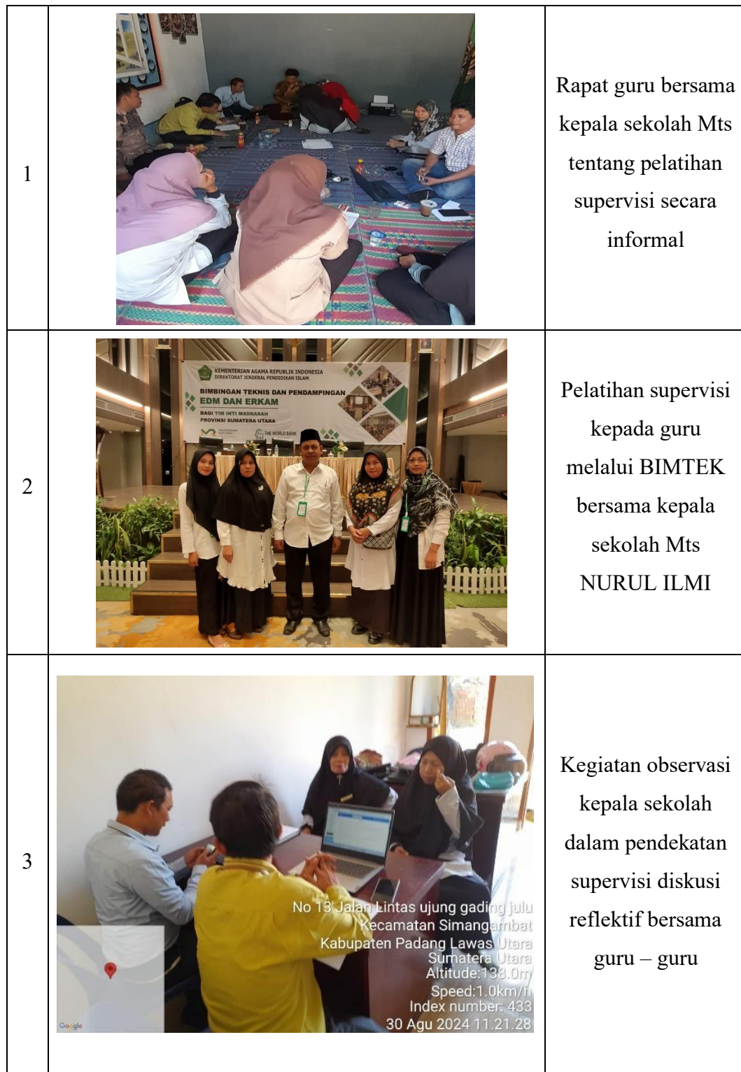
Gambar 5.3 Kegiatan supervisi kepala sekolah dalam profesionalisme guru