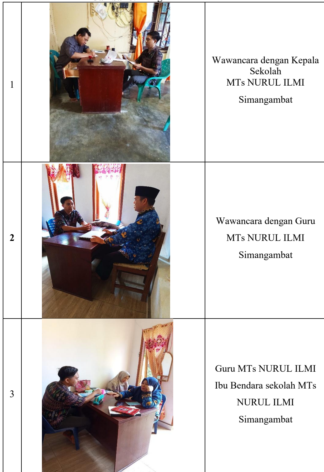
Gambar 5. 1 Kegiatan wawancara