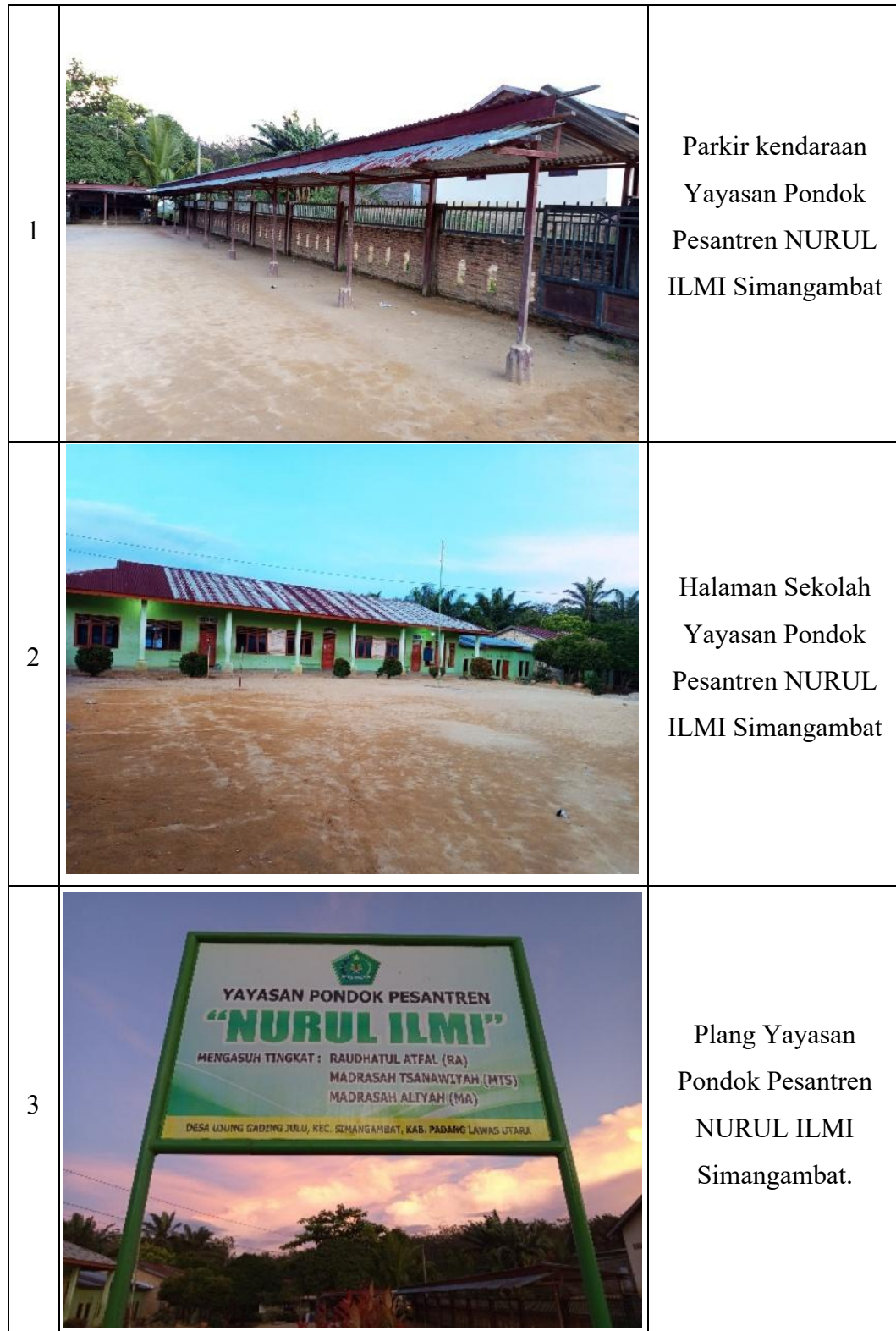
Gambar 5. 2 Lingkungan Sekolah MTs NURUL ILMI Simangambat