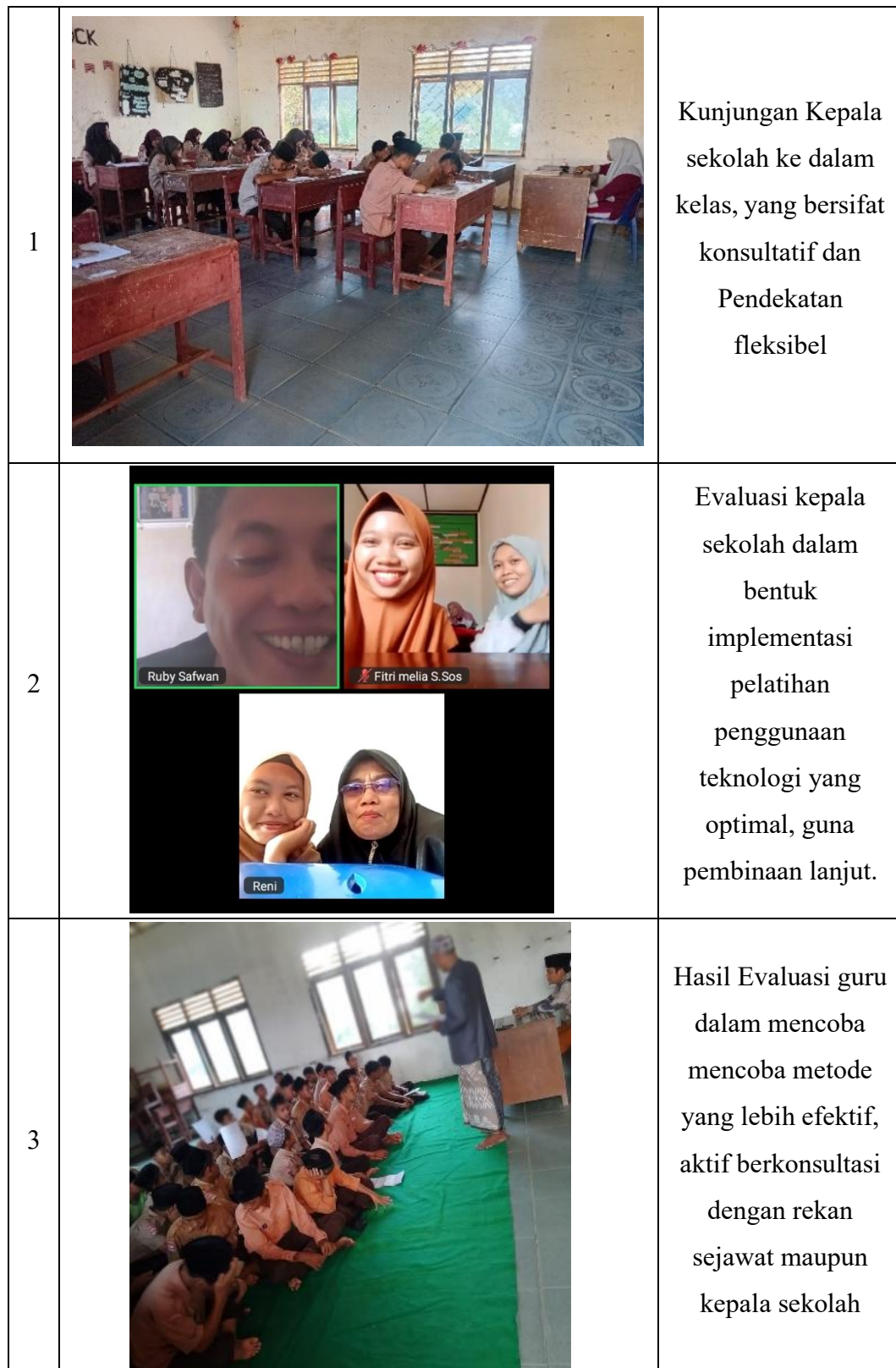
Gambar 5. 4 Evaluasi dalam pelaksanaan dan pelatihan guru