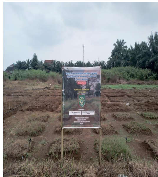
11. Gulma Setelah Aplikasi Pestisida