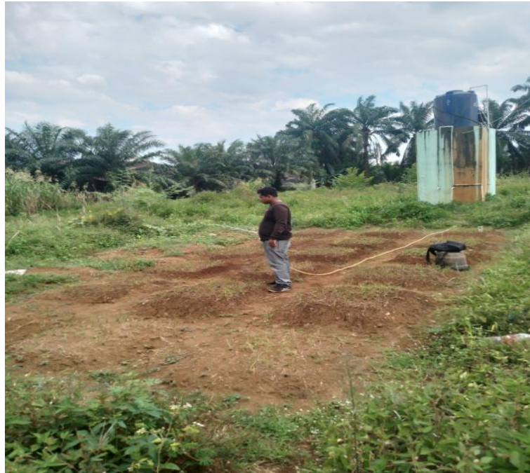
7. Pengamatan Persentase Gulma Menguning dan Kematian Gulma