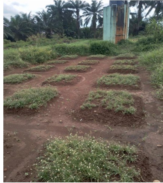
10. Gulma Sebelum Aplikasi Pestisida