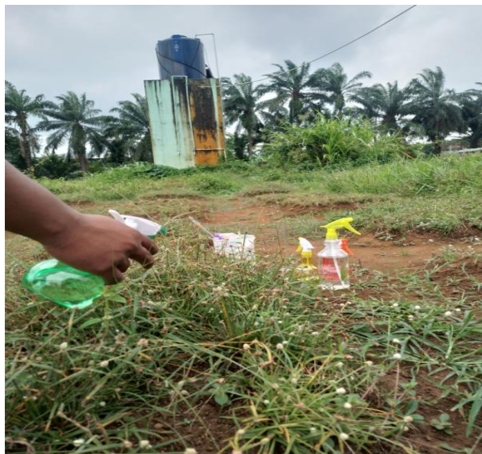
6. Aplikasi Pestisida