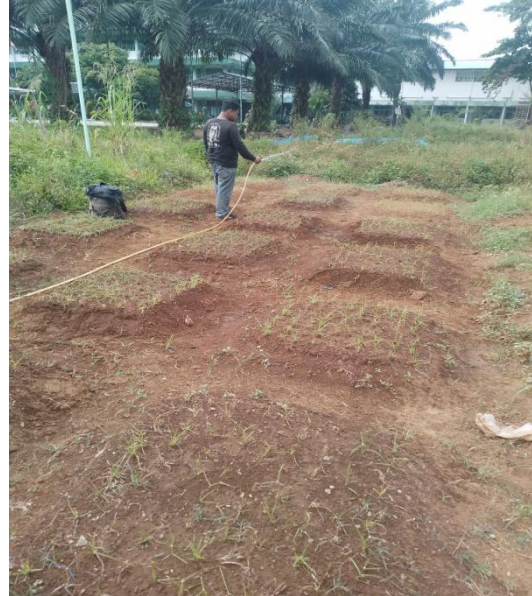
5. Menyiram Tanaman