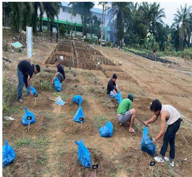
8. Bongkar Gulma