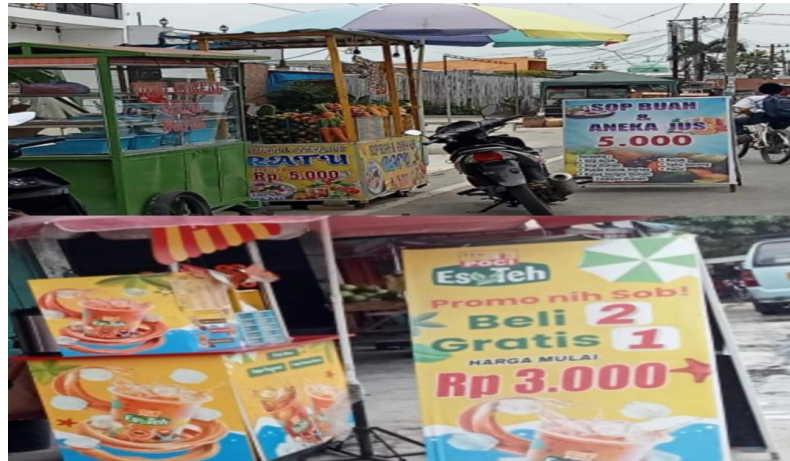
Gambar 1. 1 Pedagang UMKM Batang Kuis