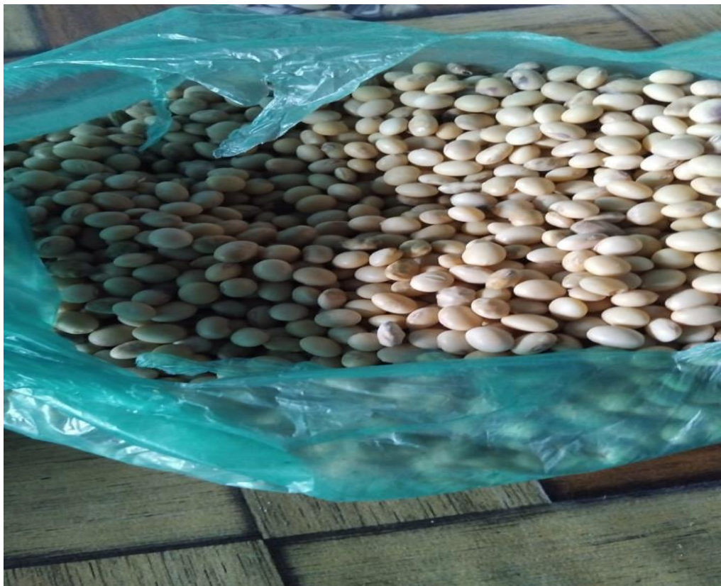
Hasil biji tanaman kedelai varietas detap-1