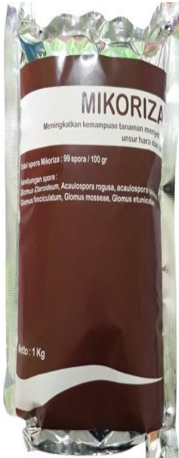
Pupuk Hayati Mikoriza