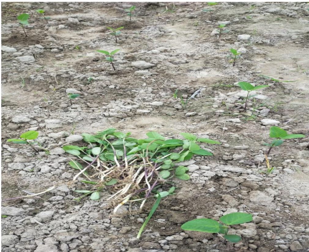
Penyisipan tanaman kedelai varietas detap-1