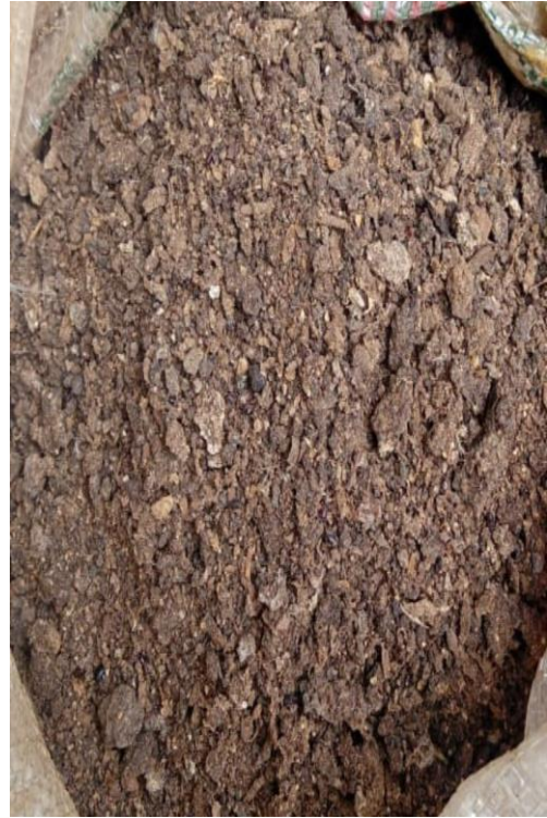
Pupuk Kandang Ayam