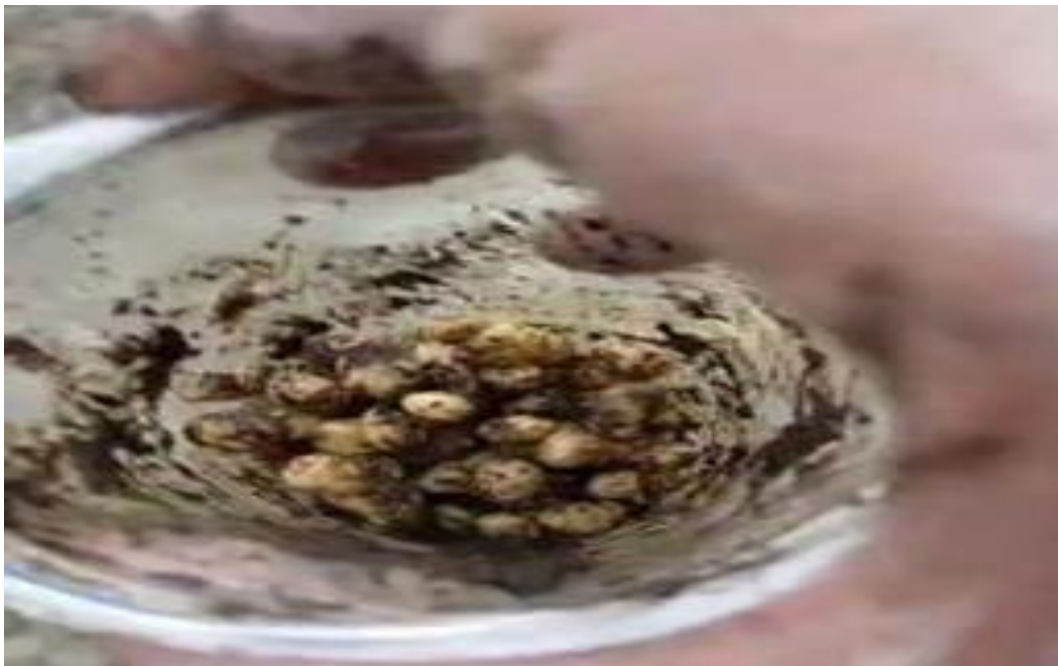
Pemberian perlakuan pupuk hayati terhadap benih kedelai varietas detap-1