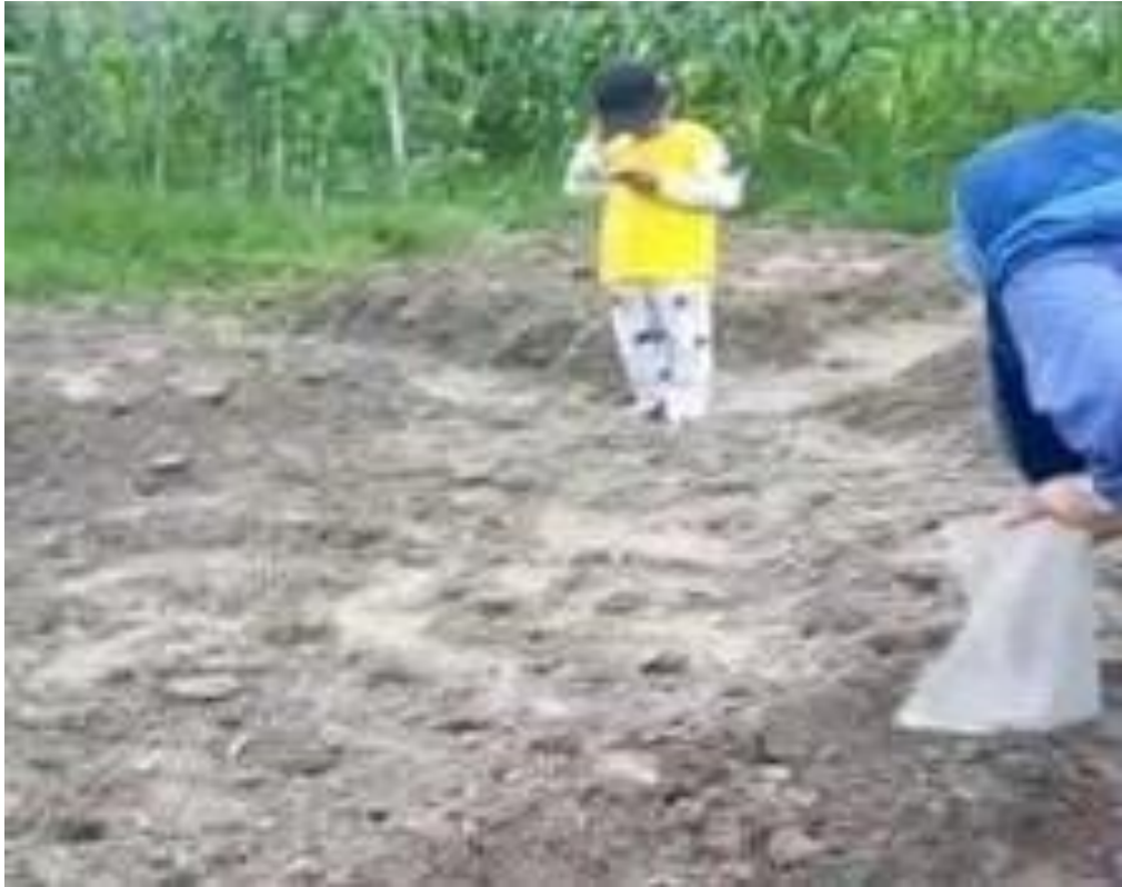
Proses penanaman kedelai varietas detap-1