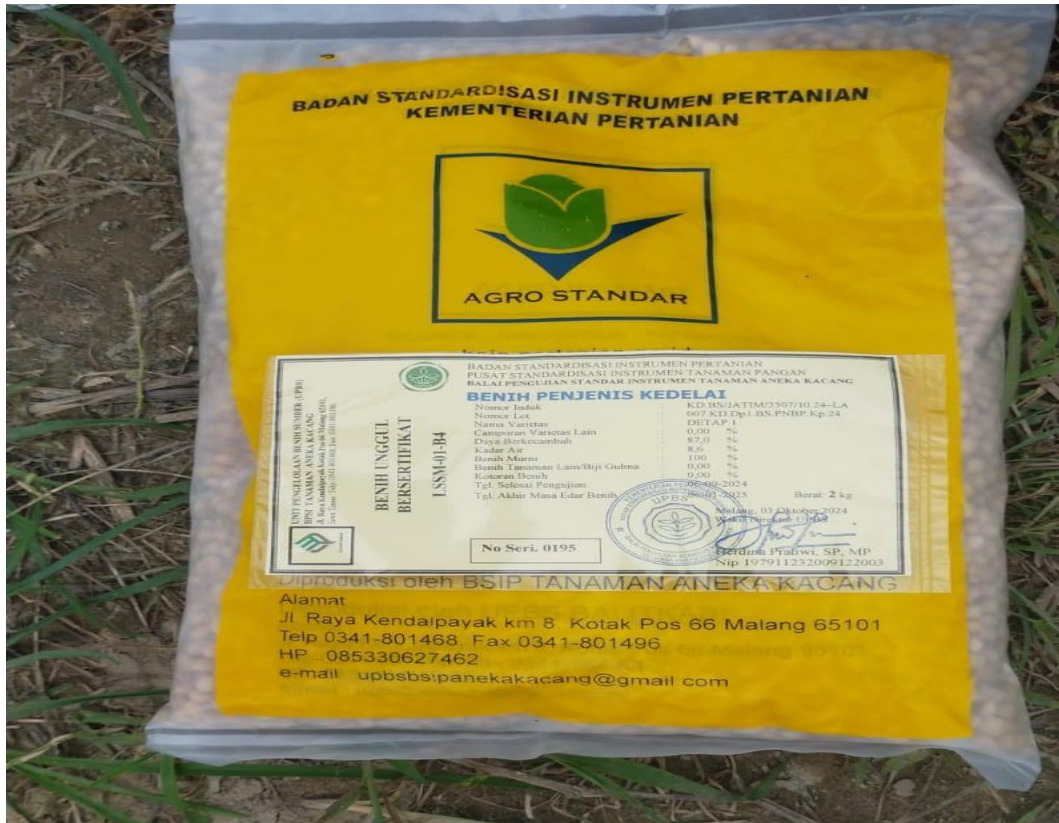
Varietas Detap-1 Tanaman Kedelai