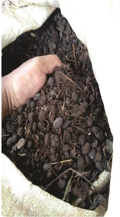
Pupuk Kandang Sapi