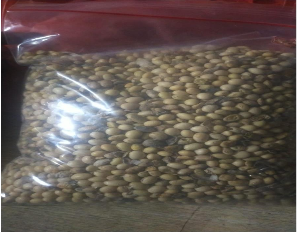
Hasil panen tanaman kedelai varietas detap-1