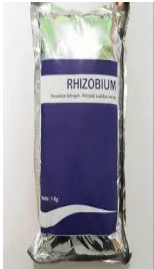
Pupuk Hayati Rhizobium