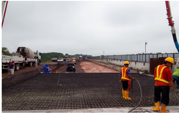
Gambar 2.2 Fondasi Raft

Fondasi raft atau raft foundation adalah jenis fondasi yang terdiri dari pelat beton bertulang yang sangat besar yang menutupi seluruh area bangunan, mendistribusikan beban ke tanah secara merata. Fondasi ini umumnya digunakan pada tanah yang lemah atau tidak stabil, di mana fondasi dangkal tidak cukup untuk menahan beban struktur. Fondasi raft efektif digunakan pada bangunan bertingkat tinggi, bangunan besar, atau struktur yang memerlukan daya dukung tinggi.