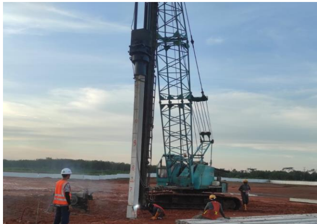
Gambar 2.5 Tiang Pancang Mini

Mini pile adalah tiang pancang yang berdiameter lebih kecil dibandingkan dengan tiang pancang standar. Fondasi ini digunakan pada tanah yang lebih sempit atau pada proyek yang memerlukan fondasi dalam pada kedalaman yang terbatas. Mini pile sering digunakan pada bangunan bertingkat rendah atau struktur kecil yang membutuhkan solusi fondasi dalam dengan biaya yang lebih rendah.