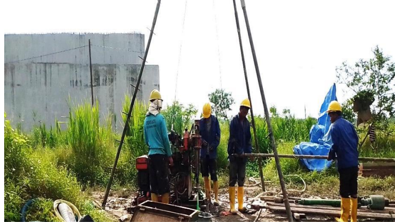
Gambar 2.6 Standard Penetration Test

tanah sejauh 30 cm pertama setelah penetrasi awal, dan nilai ini sering digunakan sebagai parameter untuk menilai kekuatan atau konsolidasi tanah (Das, 2011).