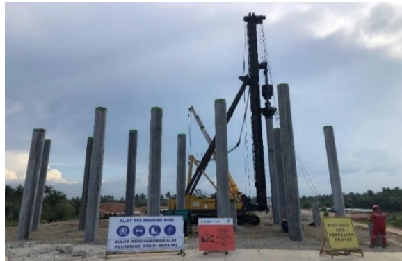
Gambar 2.3 Fondasi Tiang Pancang

Tiang pancang adalah jenis fondasi dalam yang terdiri dari pipa atau batang logam/beton yang dipancangkan ke dalam tanah untuk mencapai lapisan tanah yang lebih kuat. Tiang pancang dapat digunakan pada tanah dengan daya dukung rendah di kedalaman tertentu. Ada dua jenis tiang pancang yang umum digunakan: tiang pancang beton bertulang dan tiang pancang baja.