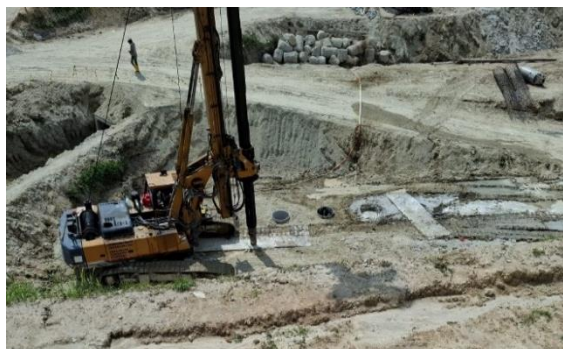
Gambar 2.4 Bored Pile

Bor pile adalah tiang yang dibuat dengan cara pengeboran ke dalam tanah menggunakan alat bor khusus, kemudian diisi dengan beton bertulang. Bor pile digunakan pada tanah yang keras atau berlumpur, dan dapat dibangun dengan kedalaman yang lebih variatif, bergantung pada kebutuhan struktur.