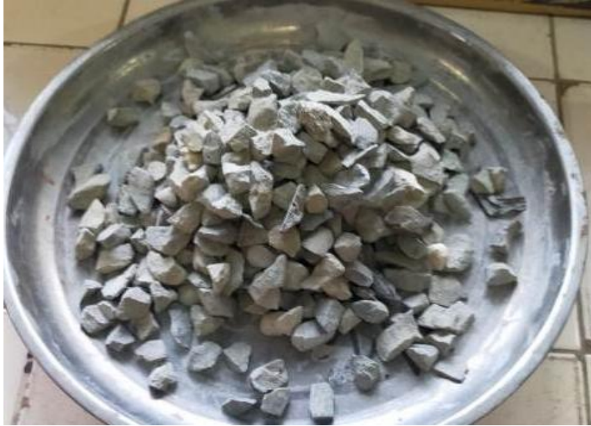
Gambar 2.4 : Agregat Kasar (Batu Pecah,Krikil)