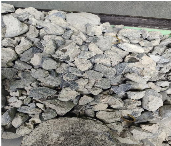
Gambar 2.3 : Pecahan limbah beton dengan mutu K-250