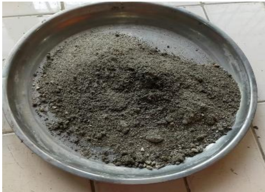
Gambar 2.5 : Agregat Halus ( Pasir )