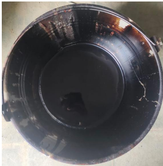
Gambar 2.2 Aspal Hasil Penyulingan Minyak

Umumnya aspal dapat dihasilkan dari penyulingan minyak bumi yang disebut aspal keras. Pada proses penyulingan tingkat pengontrolan yang dilakukan akan menghasilkan aspal dengan sifat-sifat yang khusus yang cocok untuk pemakaian pembuatan campuran beraspal, pelindung atap dan penggunaan khusus lainnya dan disamping itu pula mulai banyak juga dipergunakan aspal alam yang berasal dari Pulau Buton.