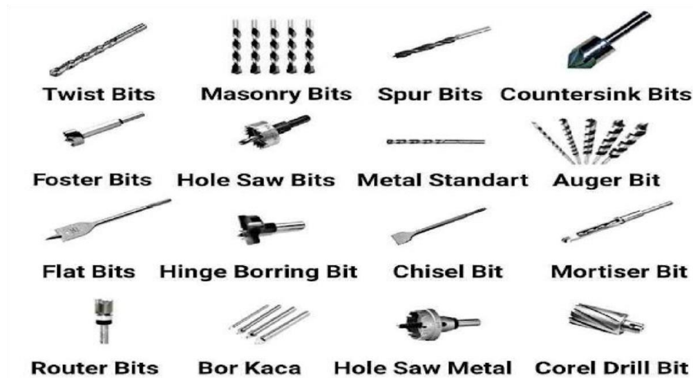
Gambar 2.1 Jenis-jenis Mata Bor

digunakan sesuai dengan kriteria yang telah ditetapkan, namun perlu diingat setiap mata bor pasti memiliki kelebihan dan kekurangan masing-masing. Jenis-jenis mata bor bisa kita lihat pada gambar dibawah :