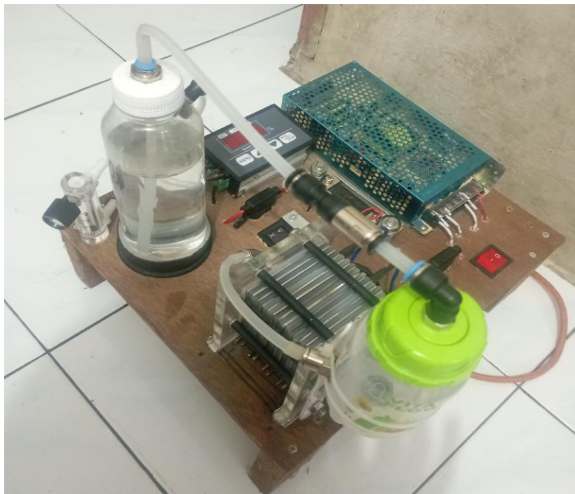
Gambar Lampiran 2. Foto Rangkaian HHO Generator Dry Cell.