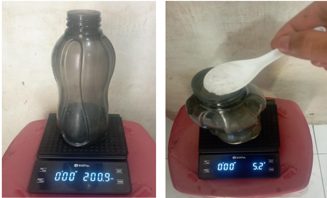
Gambar Lampiran 3. Foto Penyampuran Kalium Hidroksida (KOH) kedalam Air Deionisasi.