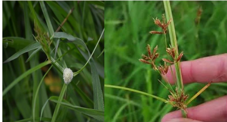
Gambar 2. 2 Gulma Teki-teki ( Sedges ). Cyperus kyllingia (kiri), Cyperus rotundus (kanan)

Gulma teki-teki yang umum dijumpai di perkebunan kelapa sawit adalah Cyperus kyllingia , dan Cyperus rotundus , (Satriawan and Fuady, 2019; Asbur et al., 2020; Asbur dan Purwaningrum, 2024b).