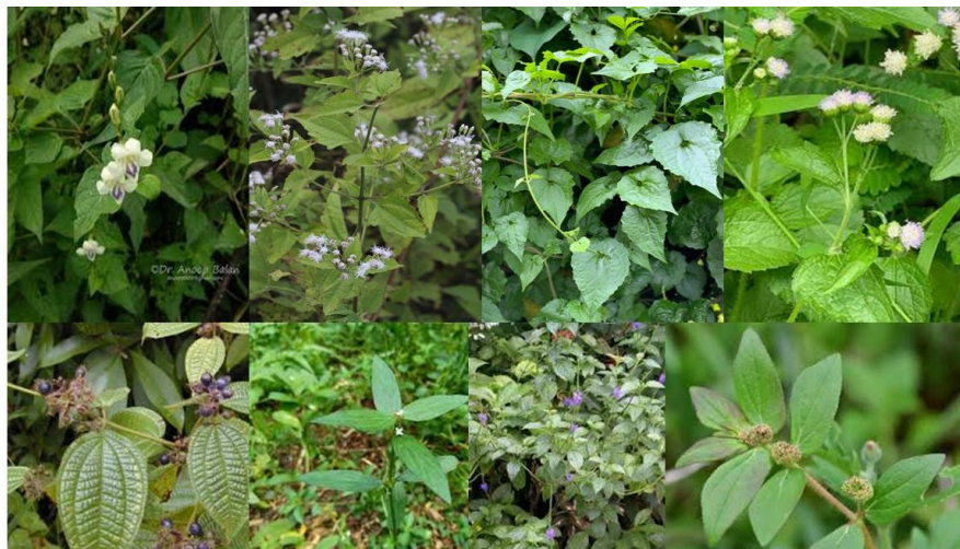
Gambar 2. 3 Gulma Berdaun Lebar ( Broad Leaves ). Atas kiri-kanan: Asystasia gangetica , Chromolaena odorata , Mikania micrantha , Ageratum conyzoides . Bawah kiri-kanan: Clidemia hirta , Borreria laevis , Stachytarpheta indica , Euphorbia hirta

Gulma berdaun lebar paling banyak dijumpai di perkebunan kelapa sawit menghasilkan dibandingkan gulma berdaun sempit dan teki-teki, diantaranya