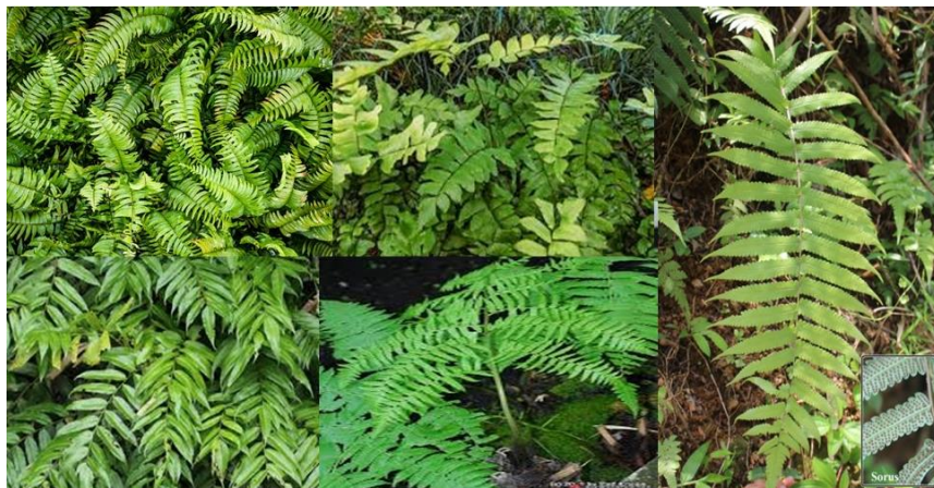
Gambar 2. 4 Gulma Pakisan ( Fern ). Atas: Nephrolepis biserrata , Adiantum trapeziforme . Bawah: Cyclosorus aridus , Diplazium asperum . Kanan: Stenochlaena palustris

Gulma pakisan juga merupakan gulma banyak dijumpai di perkebunan kelapa sawit menghasilkan dibandingkan gulma berdaun sempit dan teki-teki, diantaranya adalah Nephrolepis biserrata , Adiantum trapeziforme , Cyclosorus aridus , Stenochlaena palustris , Diplazium asperum (Satriawan and Fuady, 2019; Asbur et al., 2020; Asbur dan Purwaningrum, 2024b).