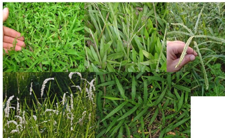
Gambar 2. 1 Gulma rumputan ( Grasses ). Atas: Paspalum conjugatum , Axonopus compressus , Eleusine indica . Bawah: Imperata cylindrica , Cyrtococcum accrescens

Menurut Kurniawati (2021), berdasarkan sifat morfologinya gulma di perkebunan kelapa sawit dibedakan ke dalam empat golongan, yaitu (1) gulma berdaun sempit ( Grasses ); (2) gulma teki-teki ( Sedges ); (3) gulma berdaun lebar ( Broad leaves ); dan (4) gulma pakis pakisan ( Ferns ).