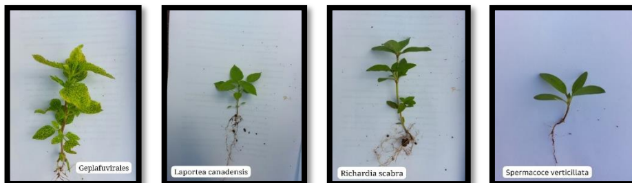
Cephaluvirales Laportea canadensis Richardia scabra Spermocoe verticillata