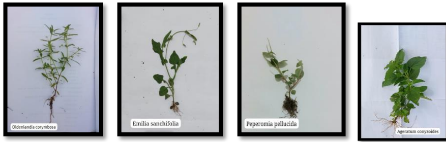
Oldenlandia corymbosa Emilia sanchifolia Peperomia pullucida Ageratum conyzoides