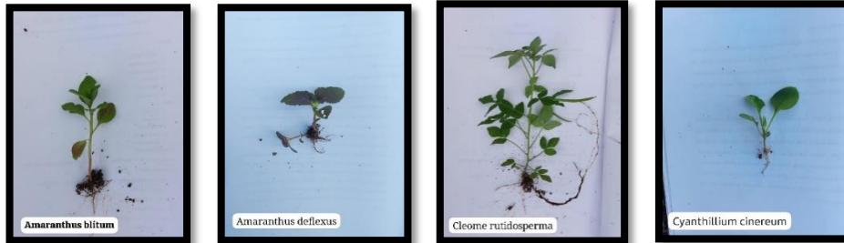
Amaranthus blitum Amaranthus deflexus Cleome rutidosperma Cyathium cinereum