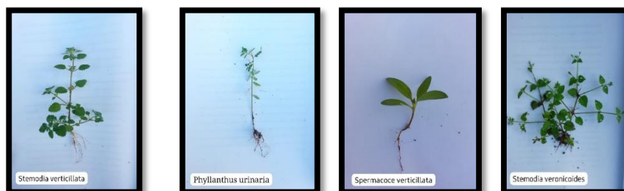
Stemodia verticillata Phyllanthus urinaria Spermacorcoecymoides Sternodia veronicoides