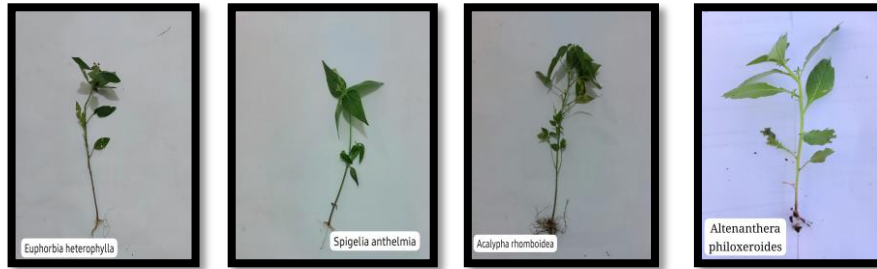
Euphorbia heterophylla Spigella anthelmia Acalypha romboidea Altenanthera philoxeroides