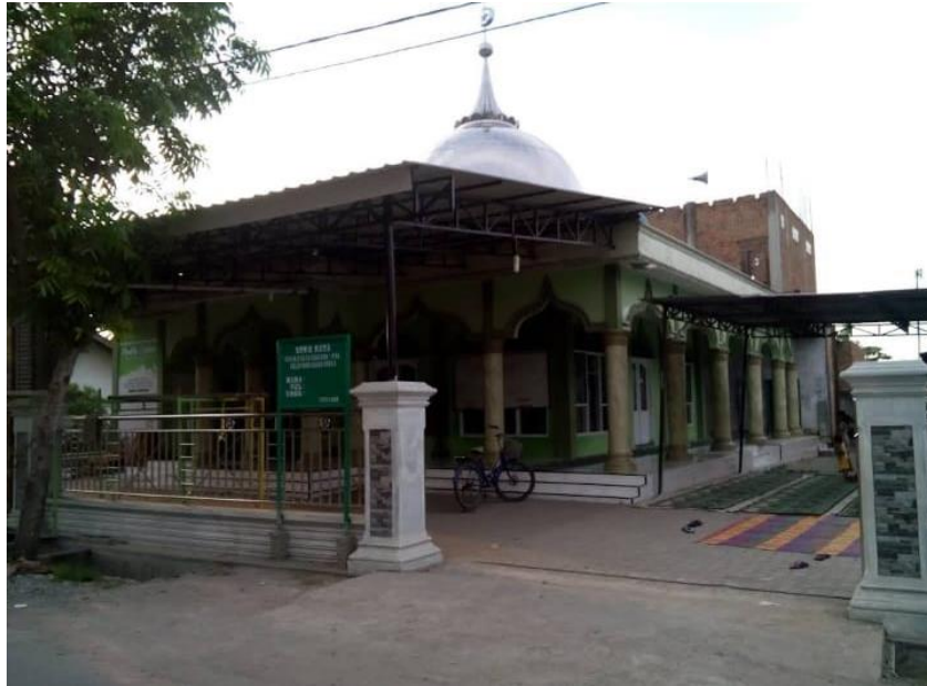
Gambar 2 2 Gambar Masjid Nurul Syuhada

TPQ (Taman Pendidikan Al-Qur'an) Nurul Syuhada adalah lembaga pendidikan non formal yang fokus pada pengajaran Al-Qur'an dan pendidikan agama Islam bagi anak-anak. Terletak di Jl. Sederhana Pasar 7, Tembung, Desa Sambirejo Timur, Kecamatan Percut Sei Tuan, TPQ ini berkomitmen untuk memberikan pendidikan yang berkualitas dan mendidik generasi muda dalam memahami ajaran Islam.