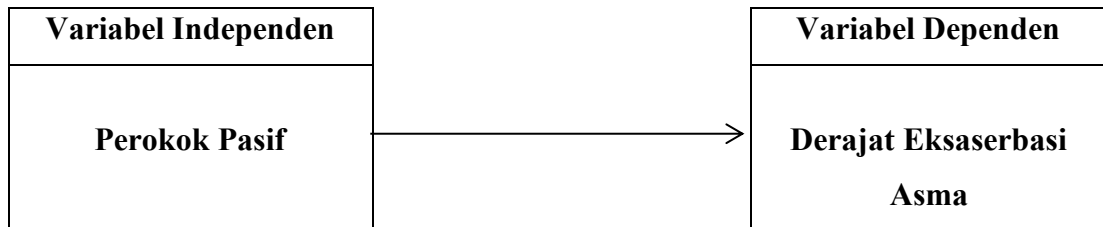
Gambar 2. 2 Kerangka Konsep