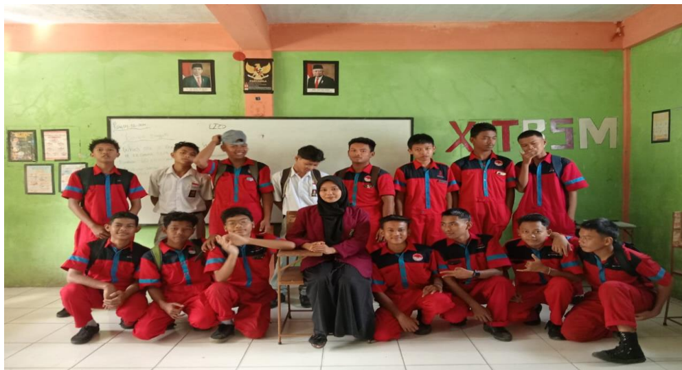
Gambar 2: Foto Bersama dengan Siswa Kelas X