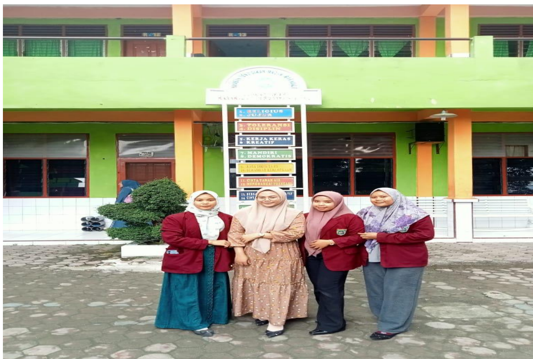
Gambar 3 : Foto Bersama dengan Guru Bahasa Indonesia