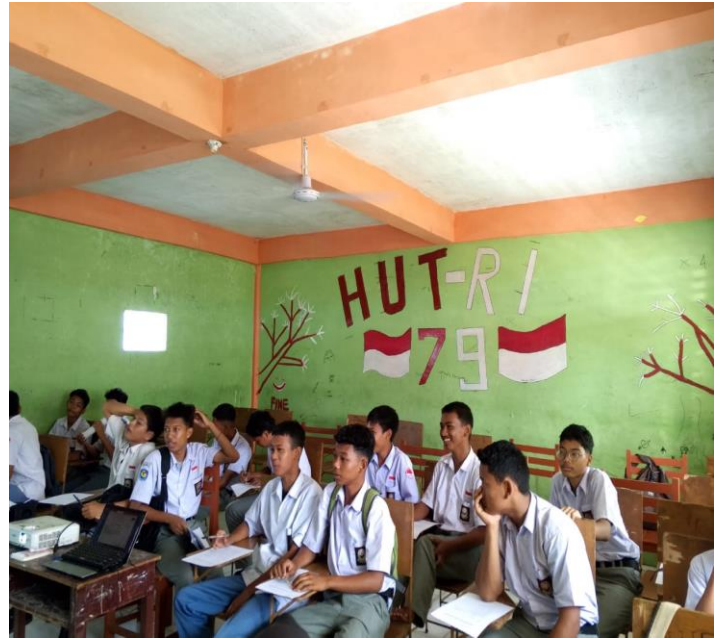
Gambar 1: Sedang Mengajar