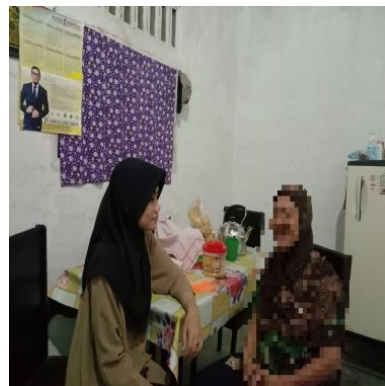
Wawancara Bersama Sepuh/Orang Tua Masyarakat Jawa 15 November 2024