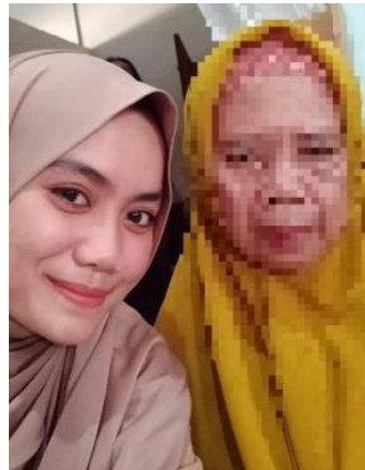
Wawancara Bersama Mantan Bidan Manten 11 November 2024