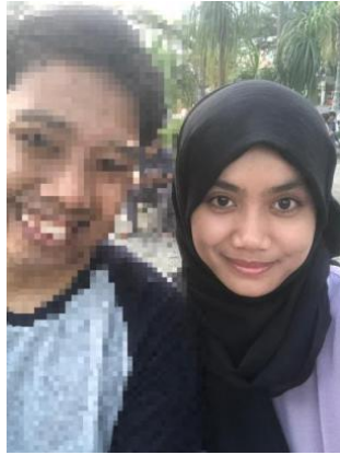
Wawancara Bersama Masyarakat Suku Batak Angkola 17 November 2024