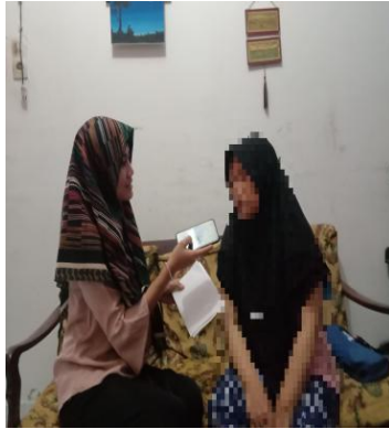
Wawancara Bersama Masyarakat Suku Melayu 16 November 2024