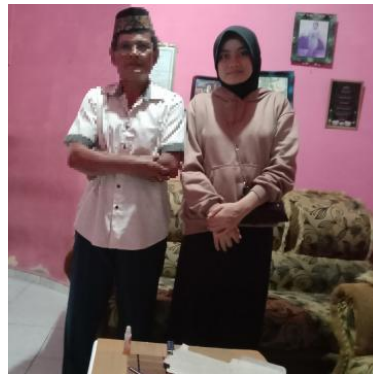
Wawancara Bersama Dukun Manten 29 November 2024