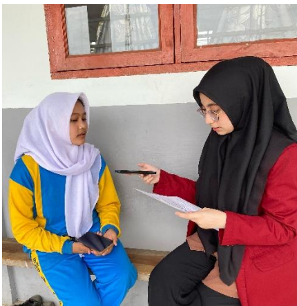
Gambar 12 Dokumentasi wawancara dengan informan 10