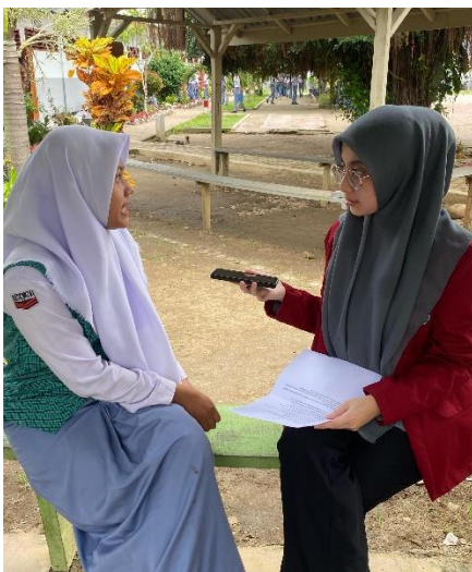
Gambar 8 Dokumentasi wawancara dengan informan 6