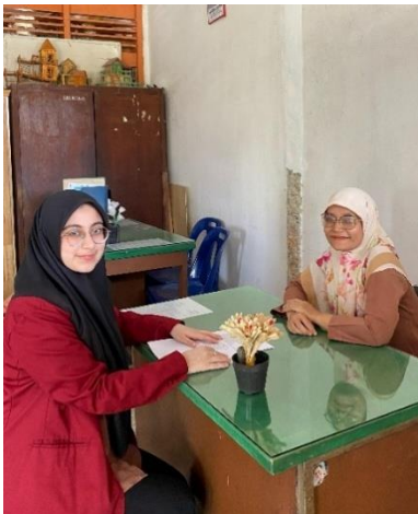
Gambar 13 Dokumentasi wawancara dengan Guru BK