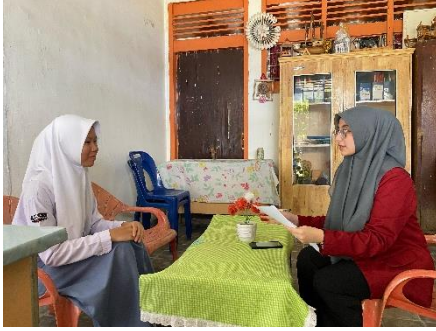
Gambar 3 Dokumentasi wawancara dengan informan 1