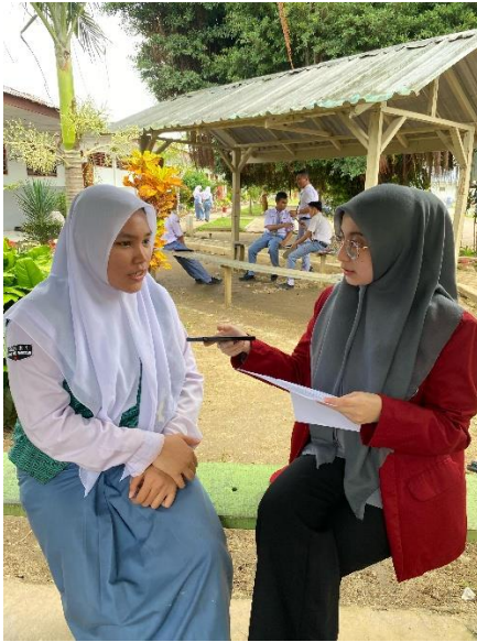
Gambar 10 Dokumentasi wawancara dengan informan 8