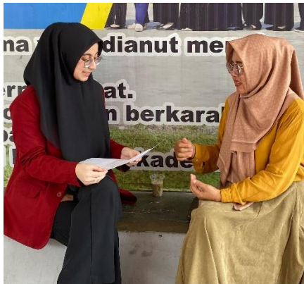
Gambar 14 Dokumentasi wawancara dengan Guru BK