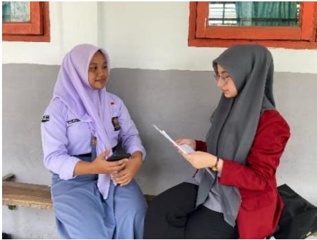
Gambar 6 Dokumentasi wawancara dengan informan 4