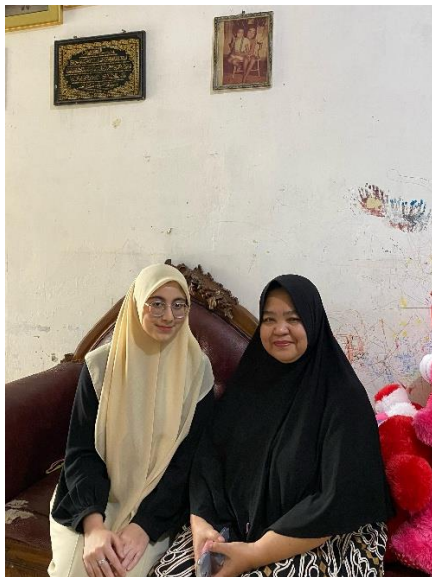
Gambar 15 Dokumentasi wawancara dengan Psikolog