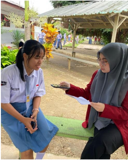
Gambar 9 Dokumentasi wawancara dengan informan 7