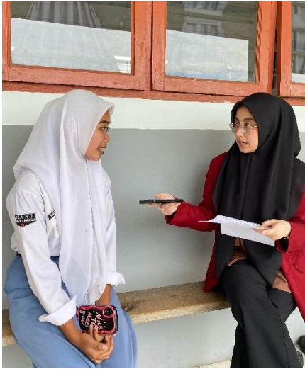
Gambar 11 Dokumentasi wawancara dengan informan 9