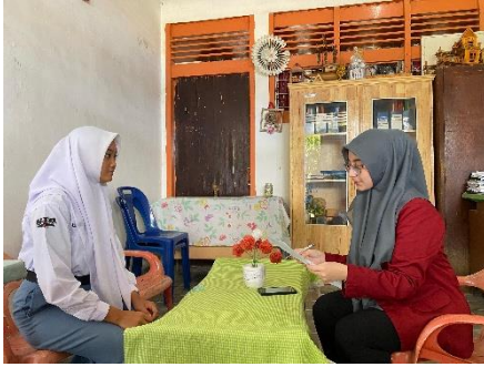
Gambar 4 Dokumentasi wawancara dengan informan 2