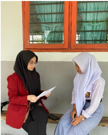
Gambar 5 Dokumentasi wawancara dengan informan 3