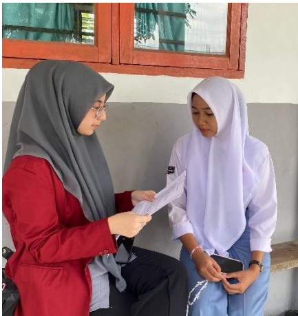
Gambar 7 Dokumentasi wawancara dengan informan 5