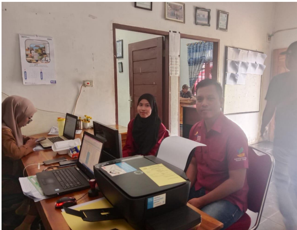
Lampiran 10 Pembina Program Keluarga Harapan