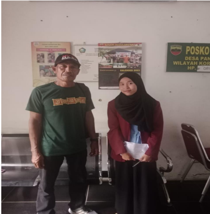
Lampiran 11 Ketua Dusun Getek 1 Desa Pantai Cermin