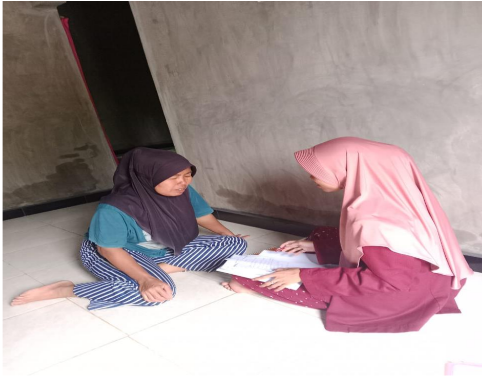
Lampiran 8 Masyarakat Desa Pantai Cermin