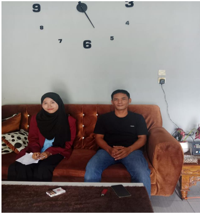
Lampiran 2 Kepala Desa Pantai Cermin