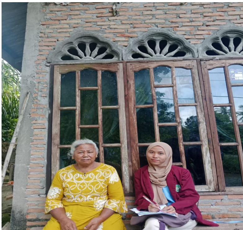
Lampiran 5 Penerima Bantuan Program Keluarga Harapan (PKH)