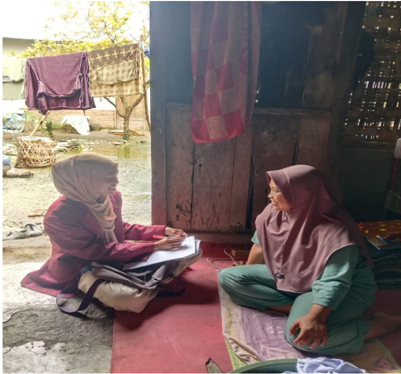
Lampiran 4 Ketua Kelompok Program Keluarga Harapan (PKH)