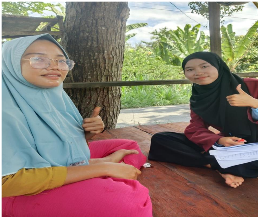
Lampiran 12 Pendamping Program Keluarga Harapan