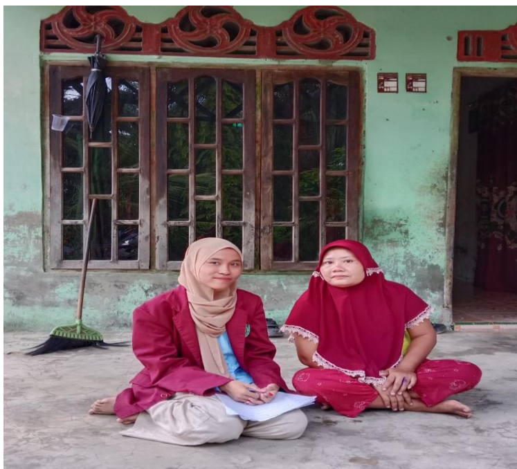
Lampiran 7 Masyarakat Desa Pantai Cermin