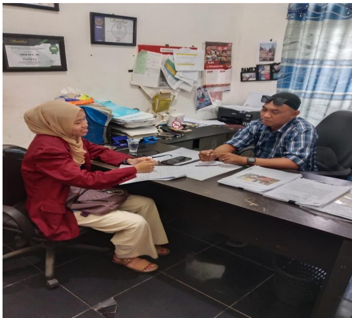
Lampiran 3 Sekretaris Desa Pantai Cermin