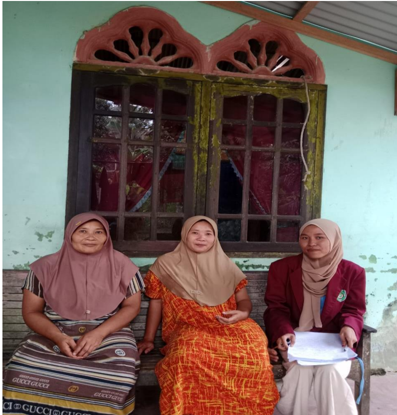
Lampiran 6 Penerima Bantuan Program Keluarga Harapan (PKH)