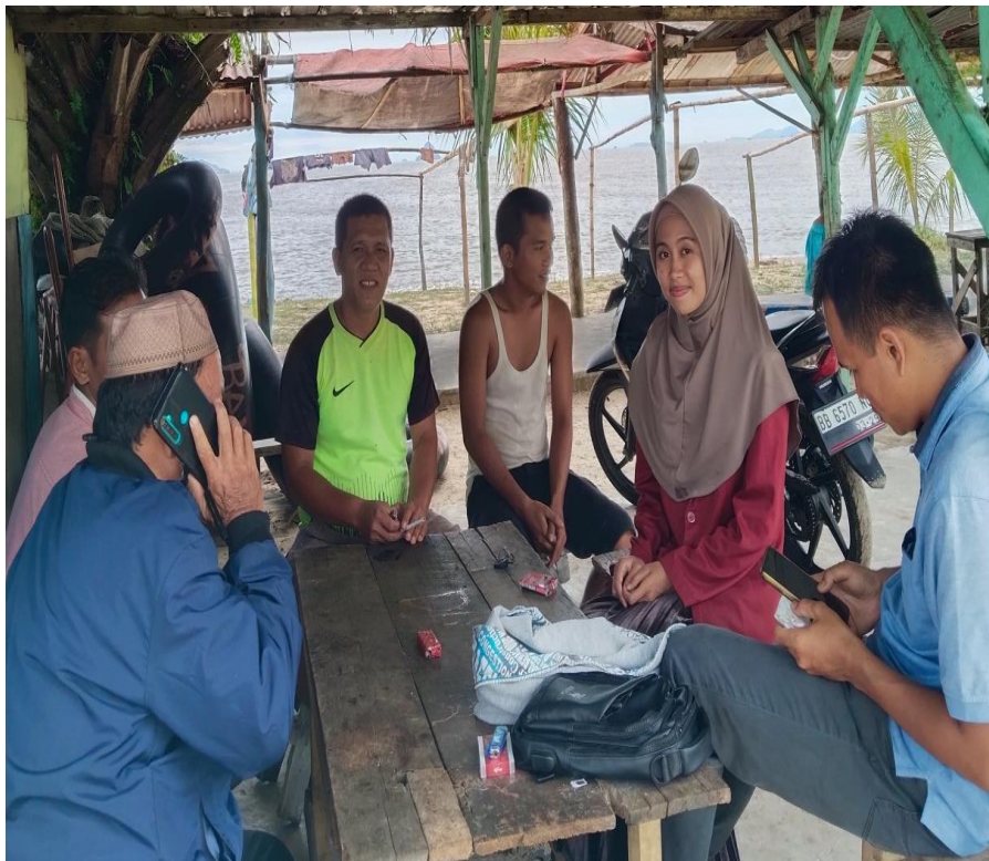
Gambar 1.8 Dokumentasi Wawancara Bersama Sekelompok Masyarakat Di Objek Wisata Pantai Kabupaten Tapanuli Tengah