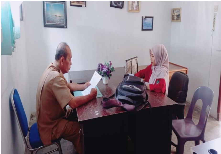
Gambar 1.1 Dokumentasi Wawancara Bersama Kepala Dinas Pariwisata Kabupaten Tapanuli Tengah