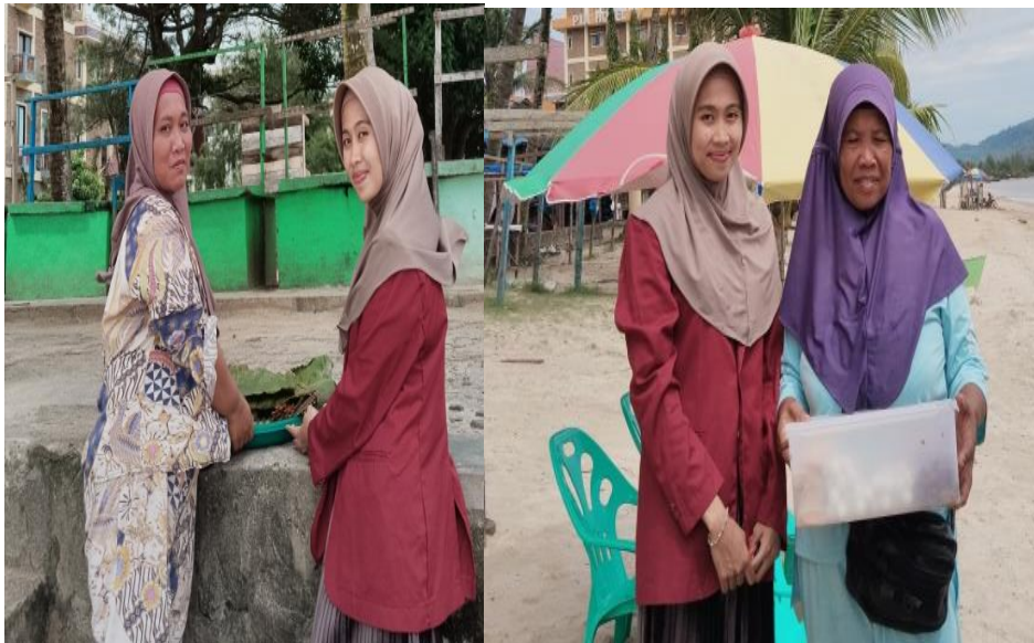
Gambar 1.10 Dokumentasi Wawancara Bersama Pedagang Sate kerang lokkan Di Objek Wisata Pantai Kabupaten Tapanuli Tengah