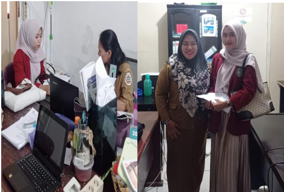
Gambar 1.2 Dokumentasi Wawancara Dengan Staf Dinas Pariwisata