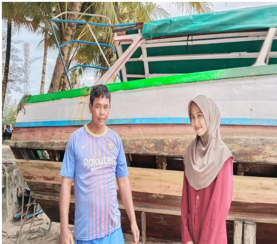
Gambar 1.4 Dokumentasi Wawancara Bersama Bapak Pemilik Kapal Wisata