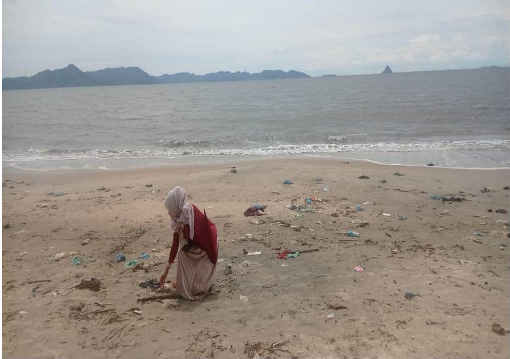
Gambar 1.3 Dokumentasi Kondisi Pantai Di Objek Wisata Pantai Indah Tapanuli Tengah, banyak sampah berserakan di sekitar pantai