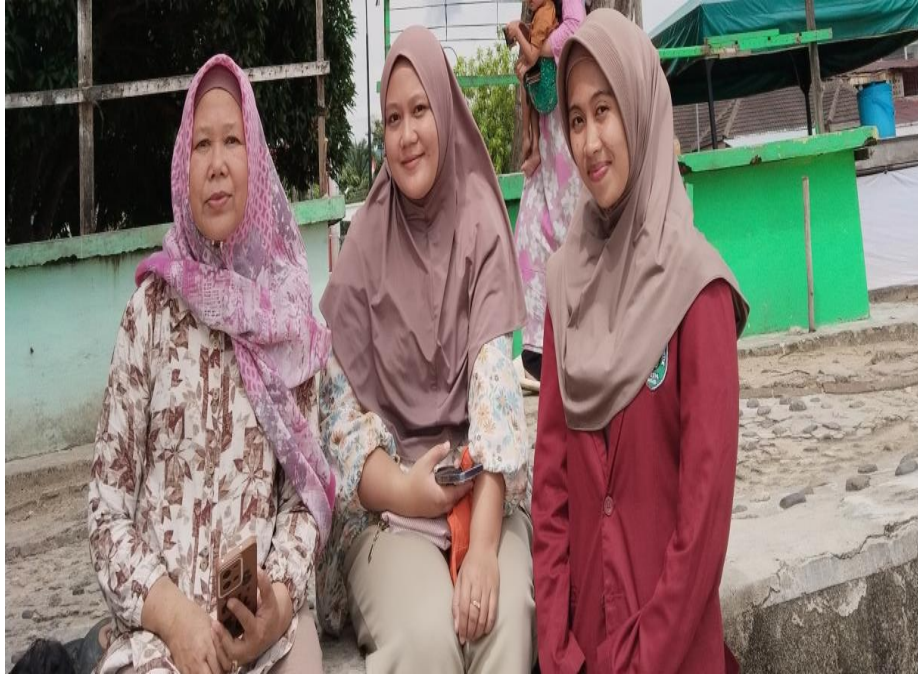
Gambar 1.7 Dokumentasi Wawancara Bersama Ibu-Ibu Pengunjung