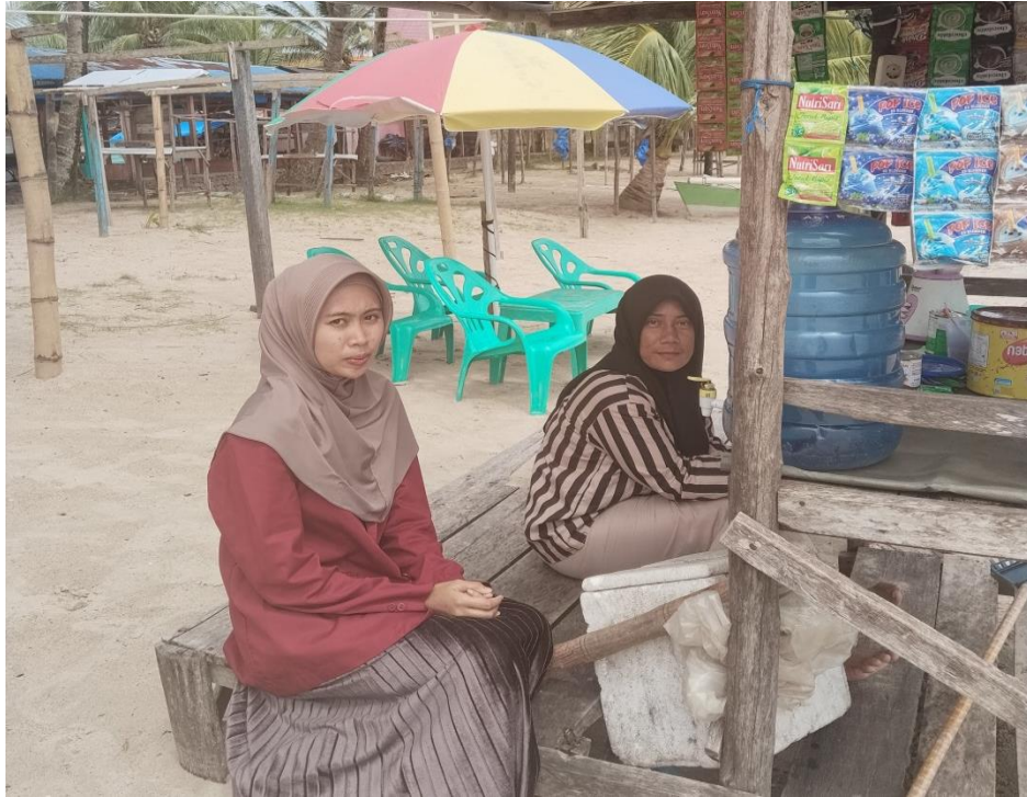
Gambar 1.5 Dokumentasi Wawancara Bersama Ibu Penjual Makanan dan Minuman Di Objek Wisata Pantai