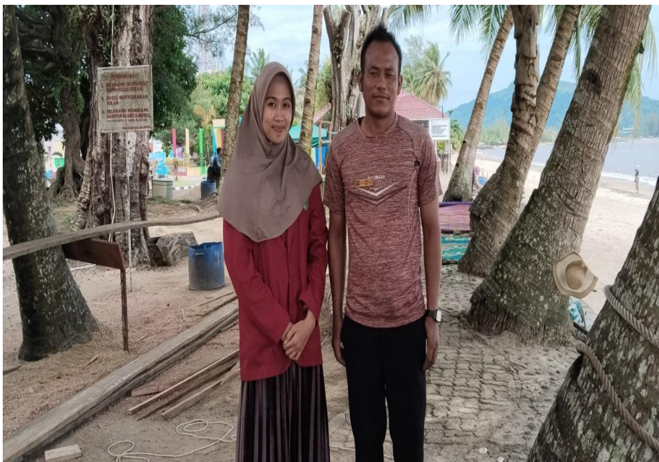
Gambar 1.6 Dokumentasi Wawancara Bersama Bapak Anggota Aktif Pokdarwis