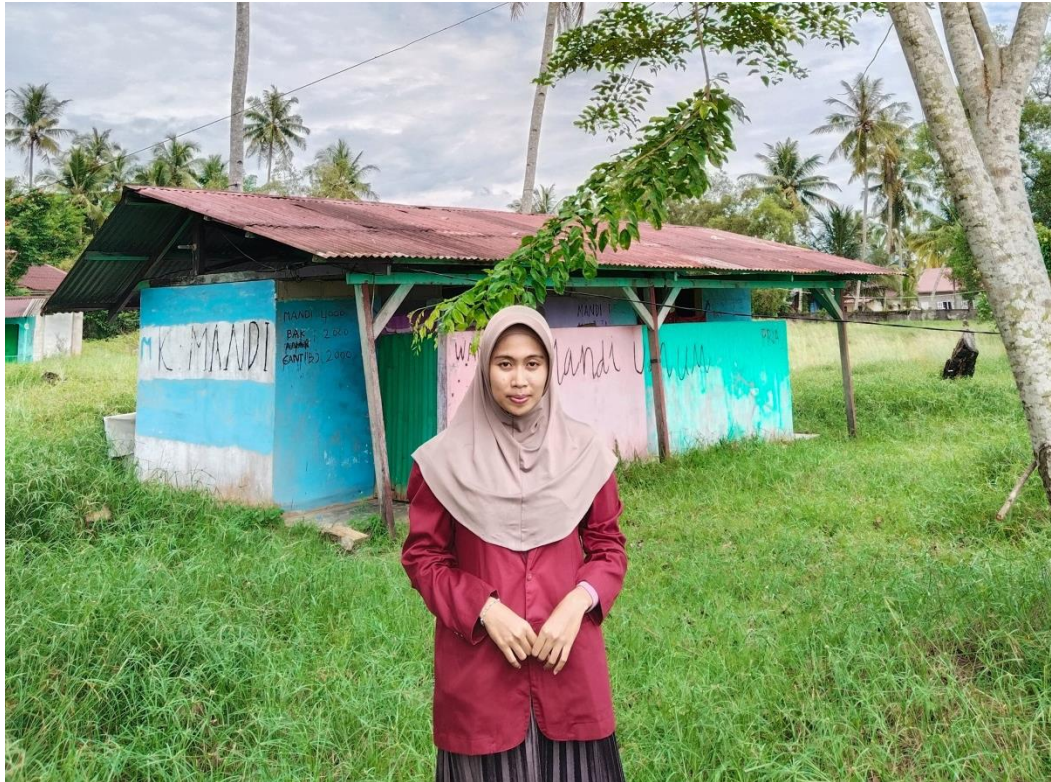
Gambar 1.9 Dokumentai Kondisi Kamar Mandi Di Objek Wisata Di Kabupaten Tapanuli Tengah