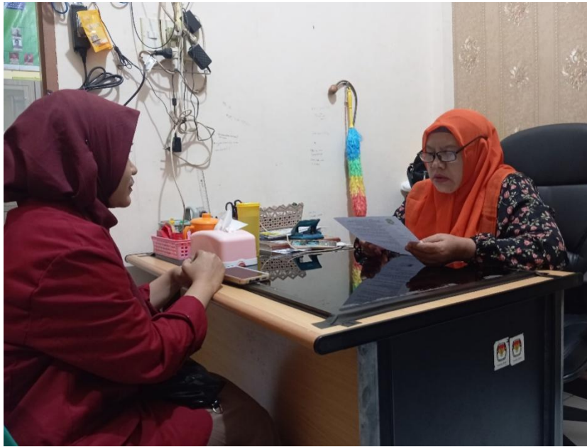
Lampiran 3 Petugas kelurahan sudirejo II