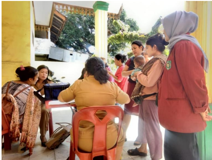
Lampiran 1 Petugas Posyandu