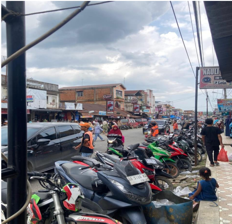
Gambar Tempat Parkir di Pusat Pasar Gunung Tua