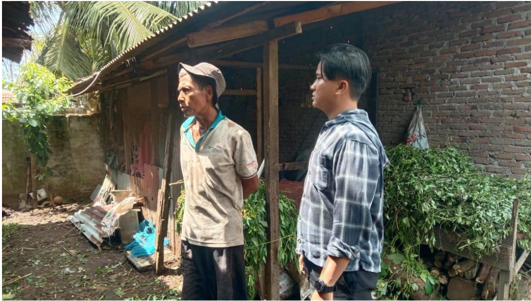
Lampiran 4 Penerima Bantuan Bibit kambing