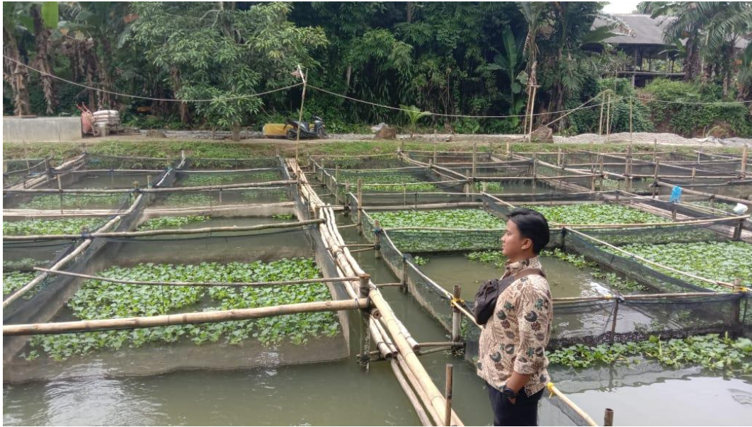
Lampiran 6 Tambak Masyarakat Desa Hulu