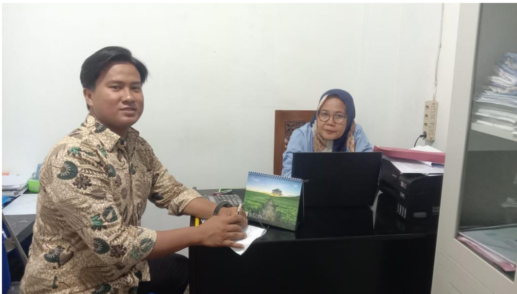
Lampiran 5 Bendahara Desa Hulu