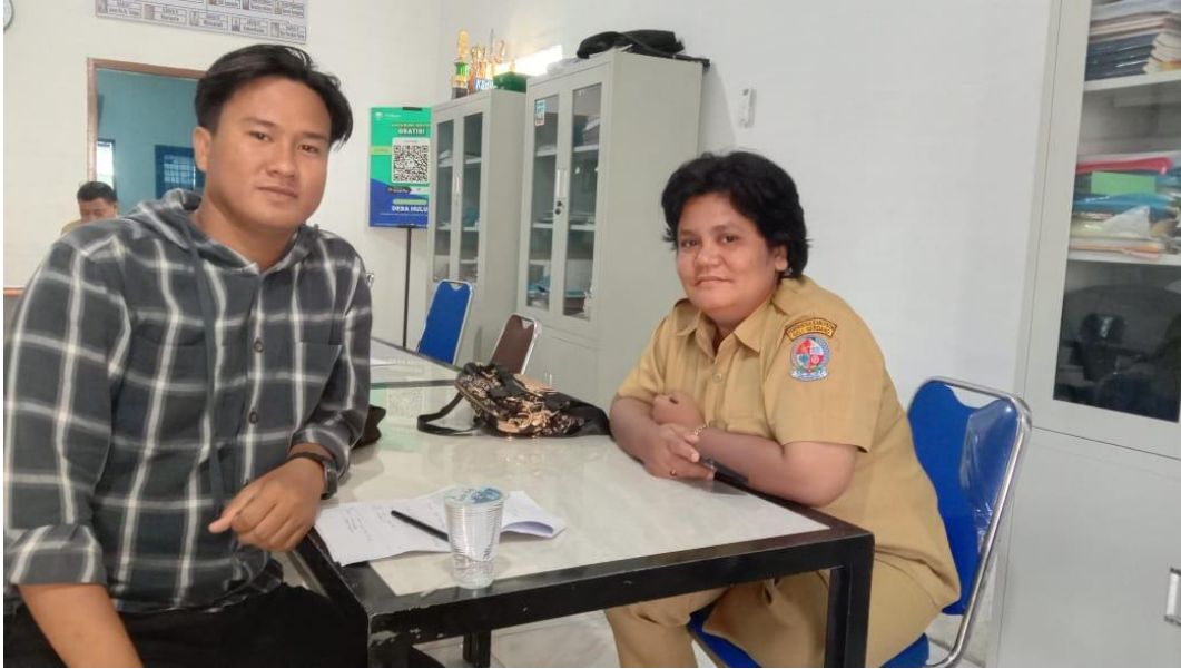
Lampiran 2 Kepala Seksi Pemerintahan