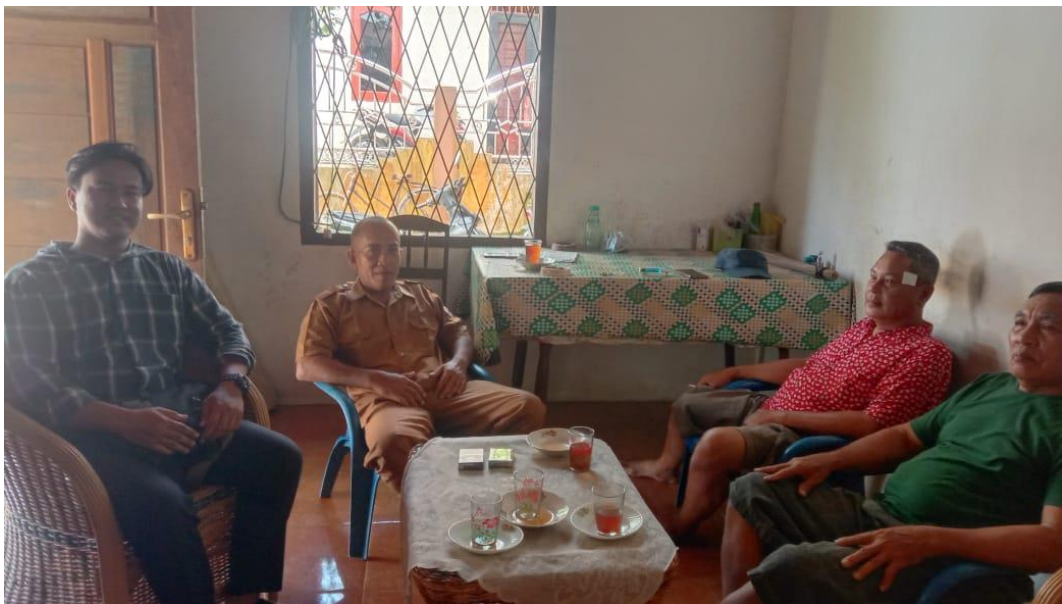
Lampiran 3 Kepala Desa dan Penerima Bantuan Bibit