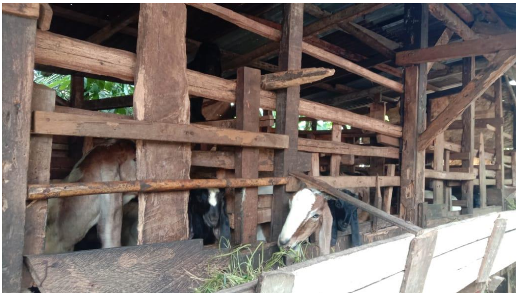
Lampiran 7 Bantuan Bibit kambing