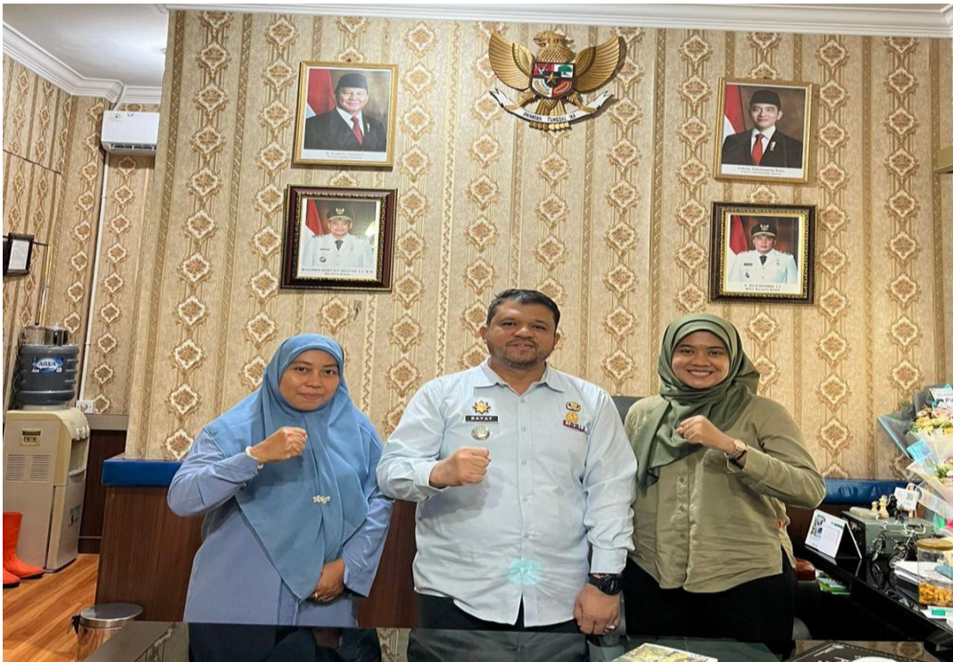
Lampiran 5 Bersama Bapak Camat dan ibu Kepala Bidang Keuangan dan Penyusunan Program