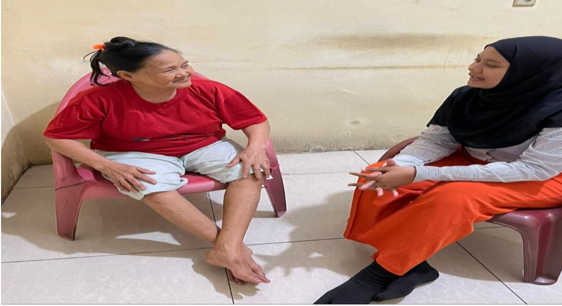
Lampiran 8 Bersama Ibu Imai Sei Kera Hilir 2