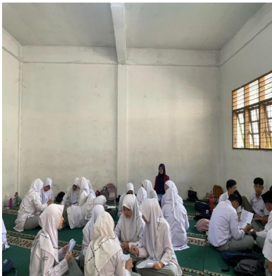
Pelaksanaan Pembelajaran dengan Metode Cooperative Learning