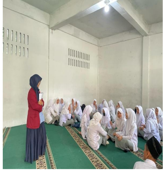
Mengarahkan Siswa untuk Membentuk Kelompok