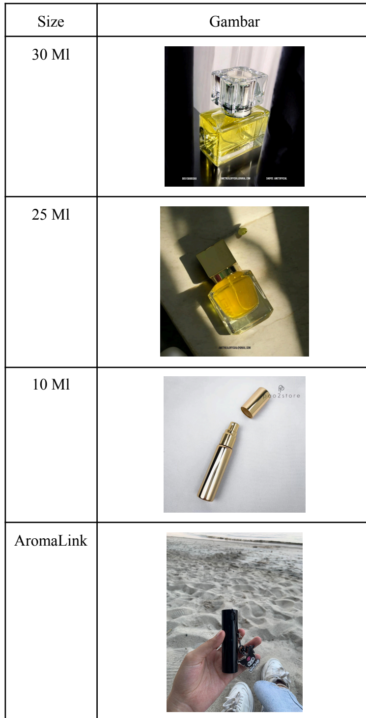
Gambar 2.1 Produk Awet Parfume