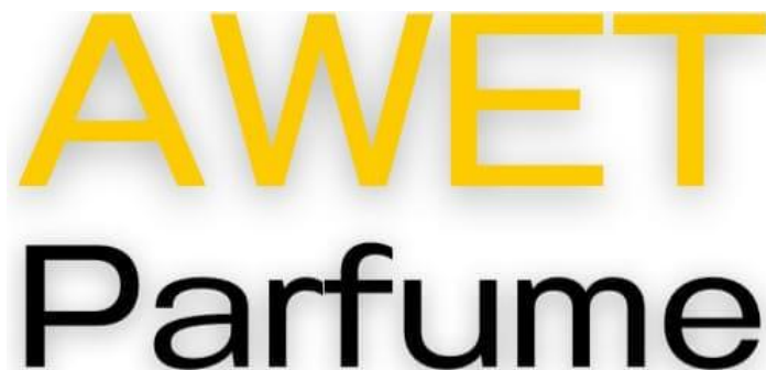
Gambar 2.1 Logo Awet Parfume