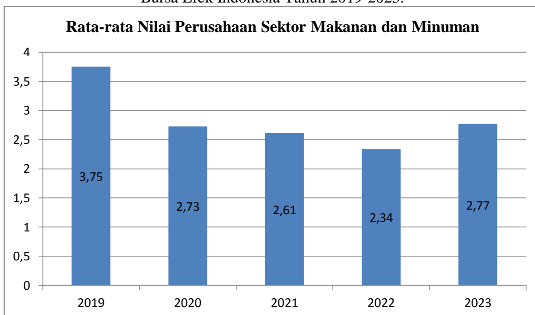
Gambar 1.1. Rata-rata Laba Bersih pada Perusahaan Sub Sektor Makanan dan Minuman di Bursa Efek Indonesia Tahun 2019-2023.

Berikut gambar grafik rata-rata laba bersih sektor makanan dan minuman 2019-2023.