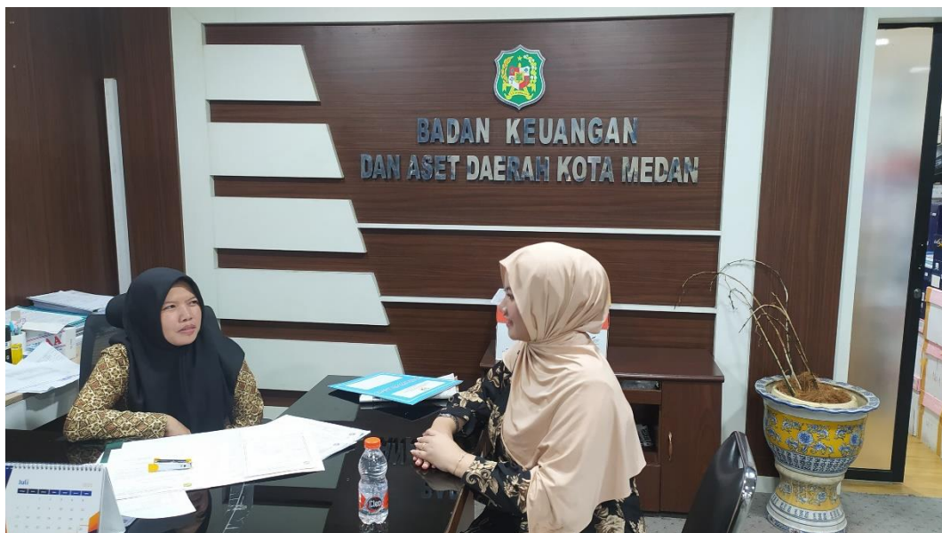
Sesi wawancara bersama dengan salah satu pegawai BKAD Kota Medan