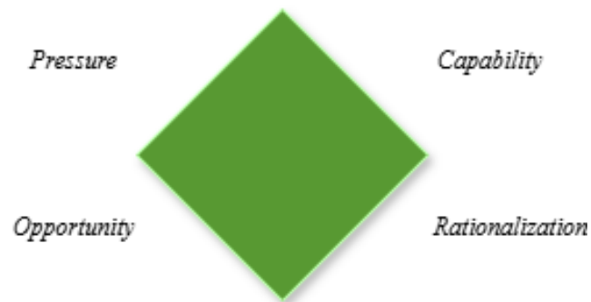
Gambar 2. 1 Fraud Diamond Theory