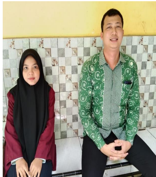
Gambar. 9 Foto dengan Bapak Guru MAN 1 Medan