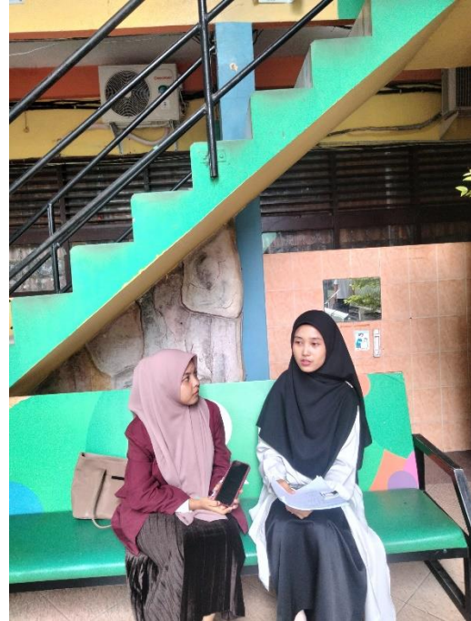
Gambar. 7 Foto dengan Ibu Guru MAN 1 Medan