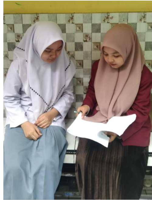
Gambar. 5 Foto dengan Peserta didik MAN 1 Medan