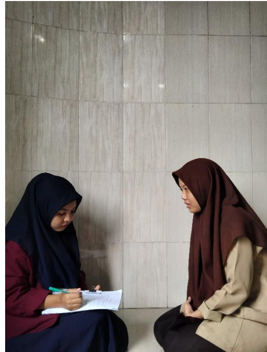
Gambar. 3 Foto dengan Peserta didik MAN 1 Medan