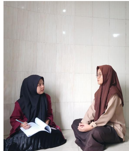
Gambar. 8 Foto dengan Peserta didik MAN 1 Medan