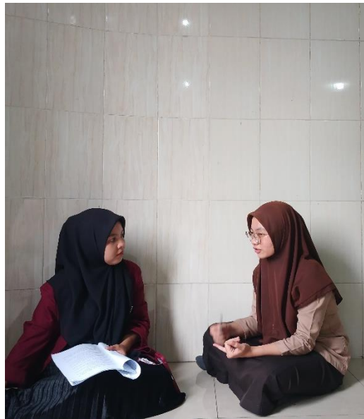
Gambar. 6 Foto dengan Peserta didik MAN 1 Medan