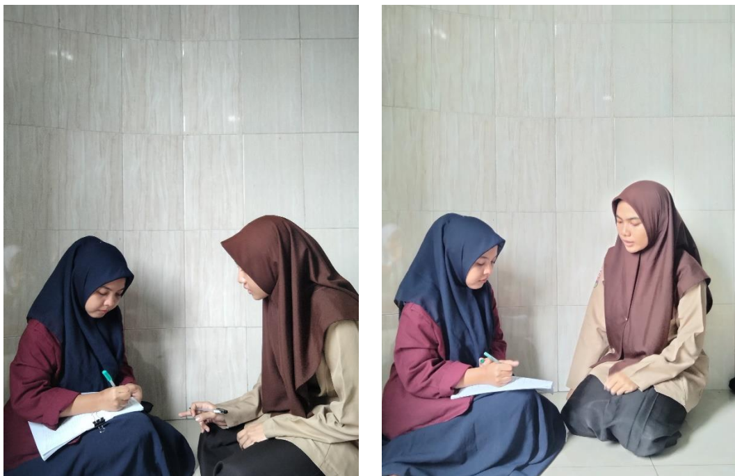
Gambar. 2 Foto dengan Peserta didik MAN 1 Medan