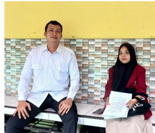
Gambar. 4 Foto dengan Bapak Guru MAN 1 Medan