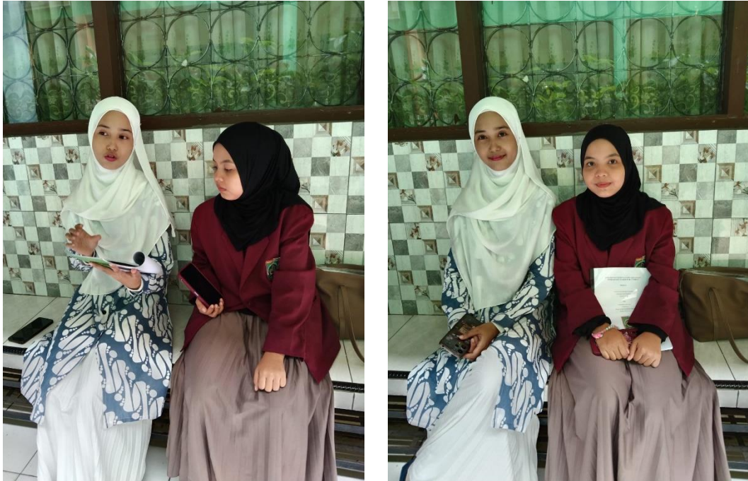
Gambar. 1 Foto dengan Ibu Guru MAN 1 Medan