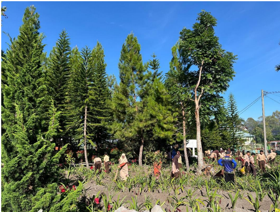
Gambar: Foto siswa sedang melaksanakan gotong royong (Kerja Sama)