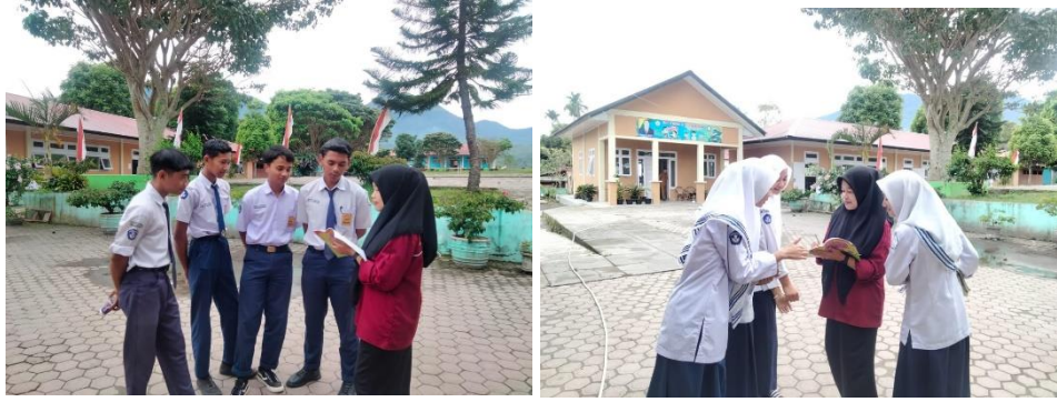
Gambar: Foto wawancara bersama siswa