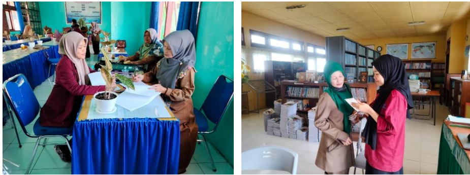
Gambar: Foto wawancara bersama guru IPS