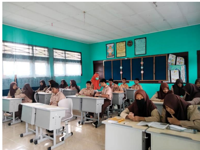
Gambar: guru IPS sedang menjekaskan materi sejarah