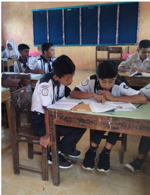
Gambar: Foto siswa memakai atribut sekolah (displin)