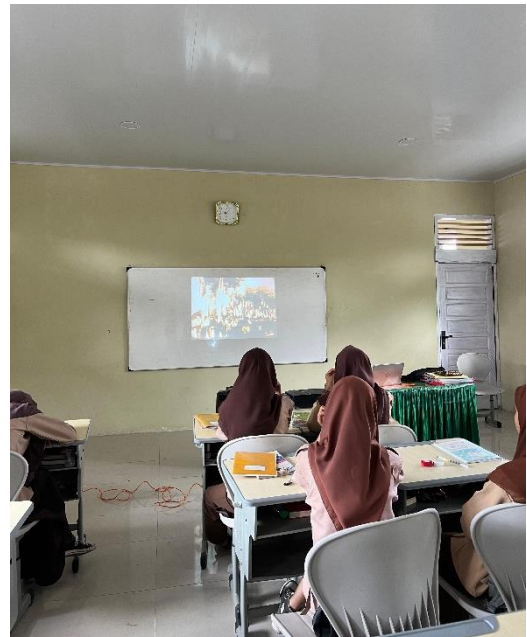
Gambar: Menonton film kemerdekaan