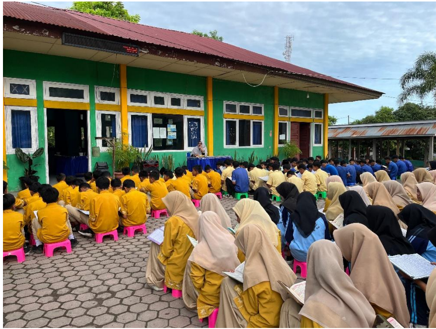
Gambar: Foto literasi membaca Al-Qur'an di pagi hari