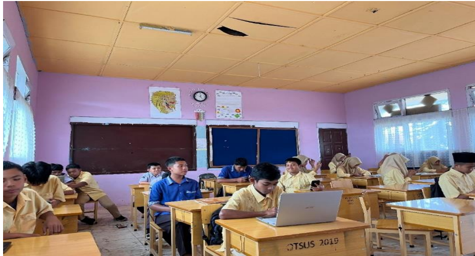
Gambar: Foto siswa mengerjakan tugas (Tanggung jawab)