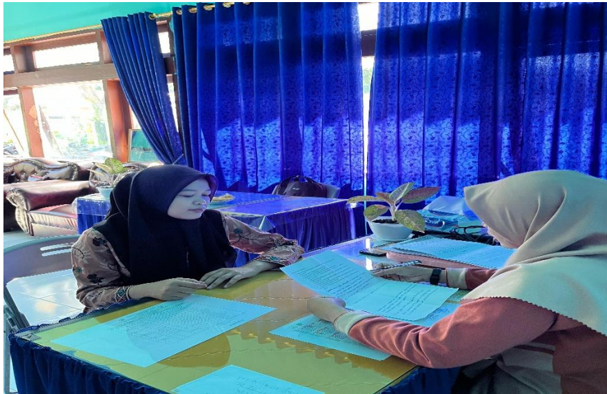
Gambar: Foto wawancara bersama wakasek bidang kurikulum