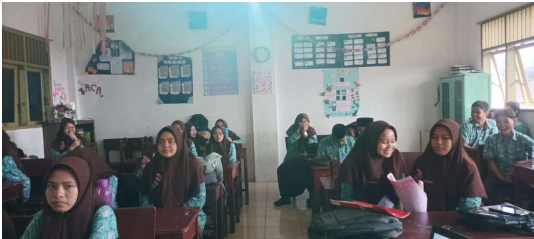
SISWA DAN SISWI KELAS X 1 AL ULUM MEDAN