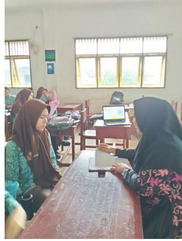
WAWANCARA DENGAN INFORMAN