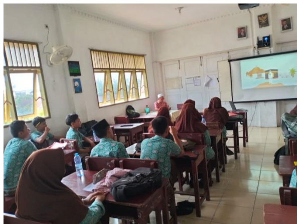
KEGIATAN PEMBELAJARAN MEDIA VIDEO HAJI DAN UMRAH