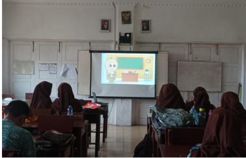
PEMBELAJARAN MEDIA VIDEO