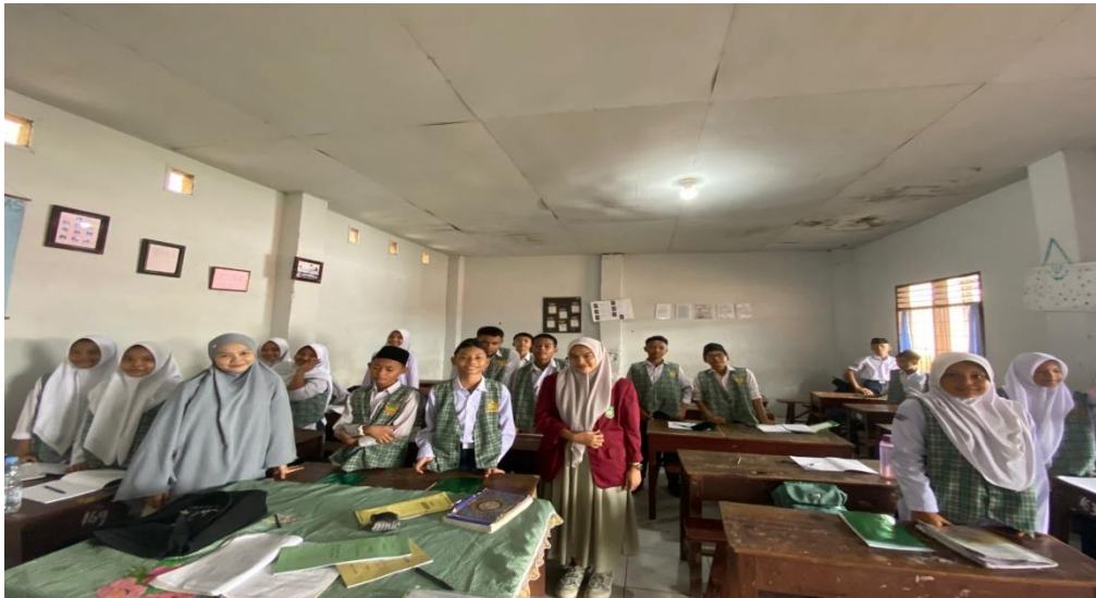
Gambar Dokumentasi Dalam Kelas VIII MTs Darul Aman Medan