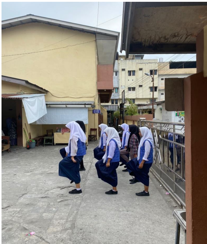
Gambar Dokumentasi Dalam Kegiatan Pramuka Mts Darul Aman Medan