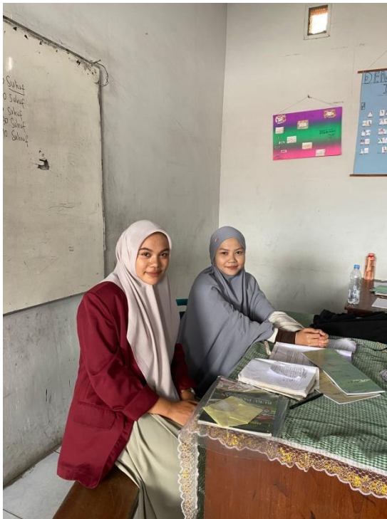
Gambar Dokumentasi bersama Guru Akidah Akhlak MTs darul Aman Medan