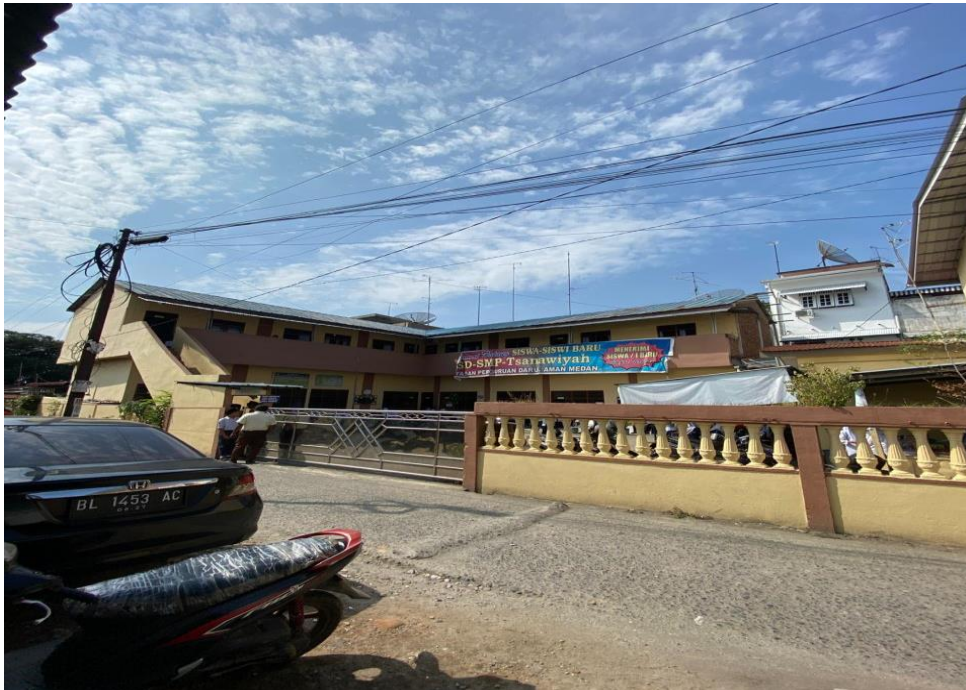
Gambar Dokumentasi Gerbang Masuk MTs Darul Aman Medan