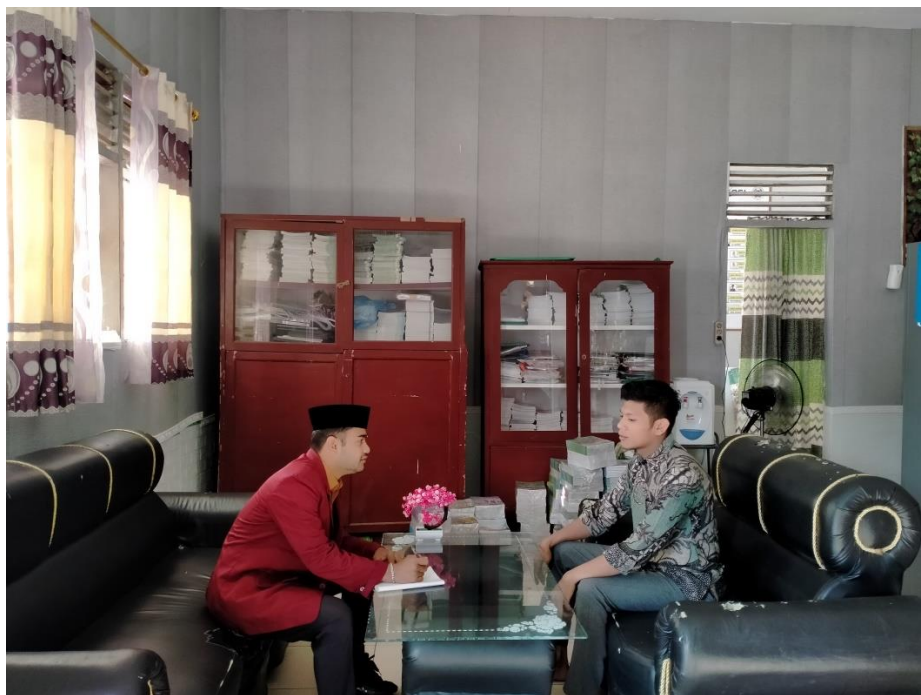
Gambar 3. Wawancara dengan Guru Pondok Pesantren Al-Husna