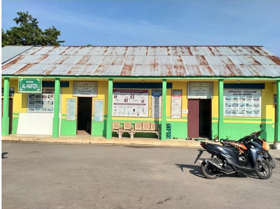
Gambar 1. Kantor Yayasan Perguruan Pesantren Al-Husna