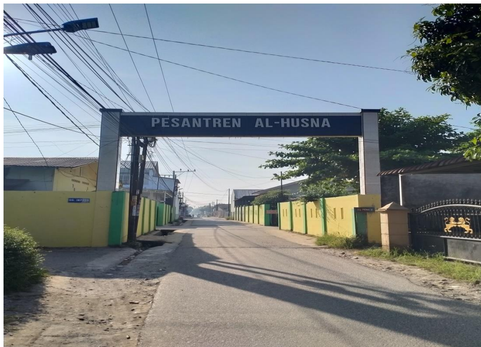
Gambar 2. Plang Pondok Pesantren Al-Husna