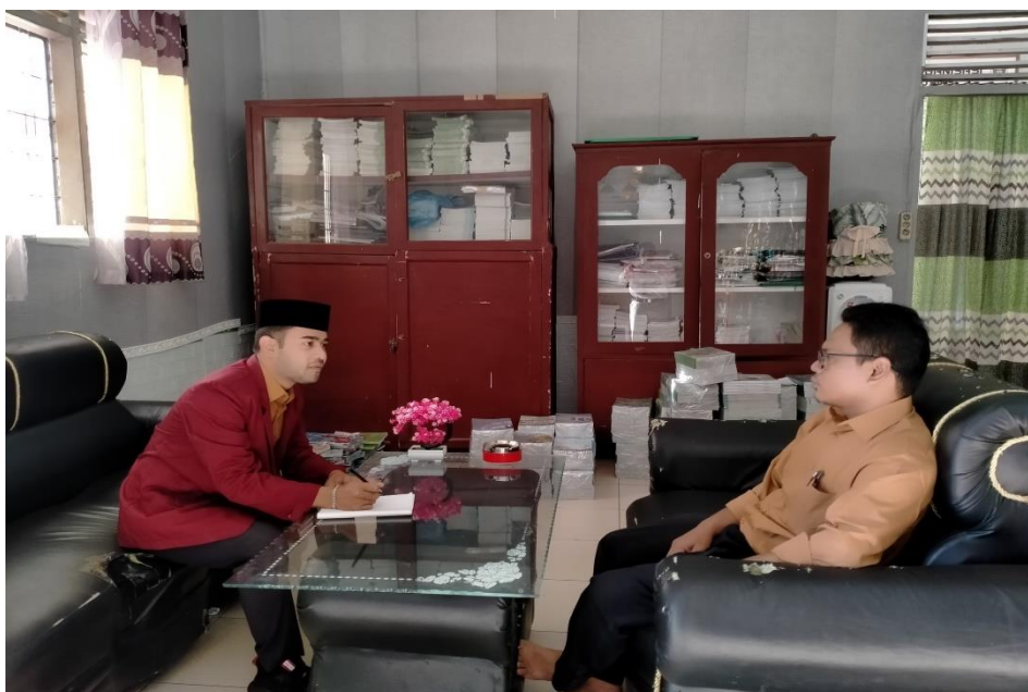
Gambar 4. Wawancara dengan Kepala Sekolah Pesantren Al-Husna