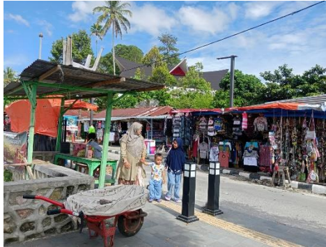
Lampiran 1: Pasar Wisatawan