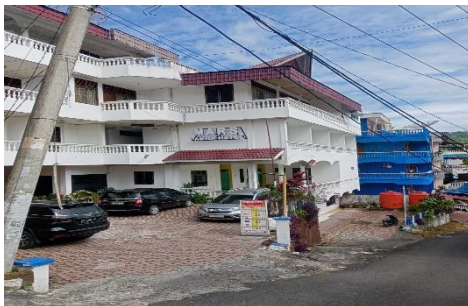
Lampiran 2: Tempat Penginapan Wisatawan