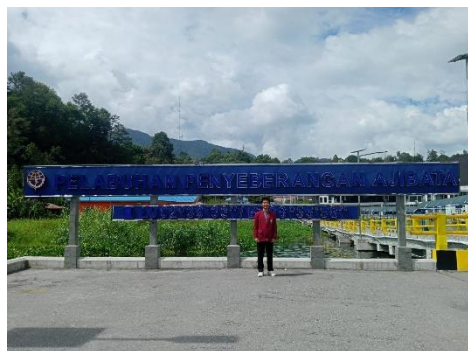
Lampiran 4: Penyebrangan Menuju Samosir