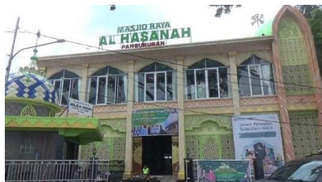
Lampiran 3: Tempat Ibadah Wisata Religi