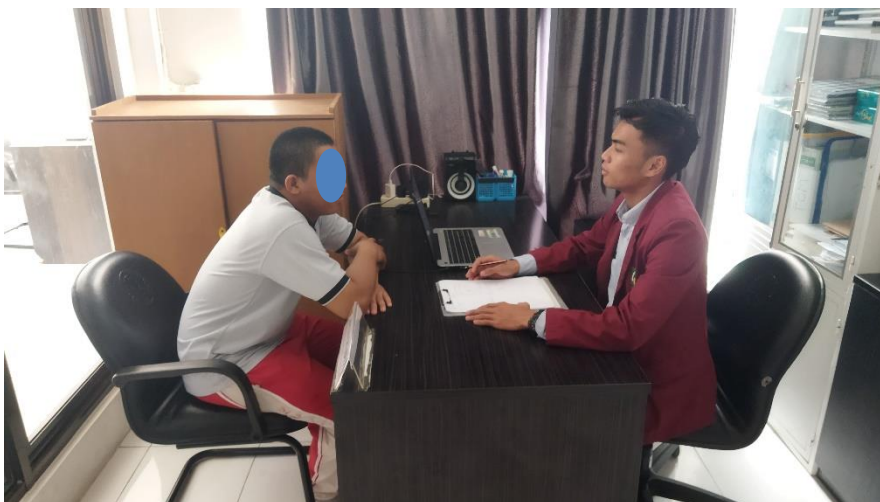
Lampiran 2. 1 Wawancara Klien