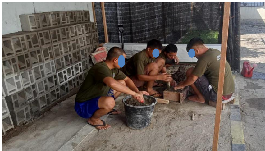
Lampiran 2. 11 Pembuatan Batu Batako