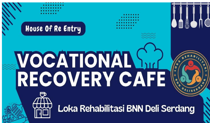
Lampiran 2. 5 Spanduk Cafe