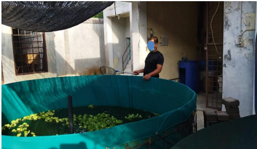
Lampiran 2. 8 Pemberian Pakan Ikan