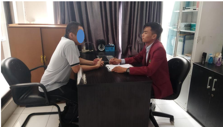
Lampiran 2. 2 Wawancara Klien