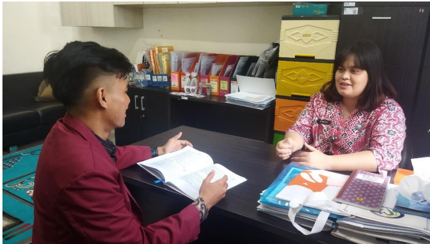
Lampiran 2. 4 Wawancara Fasilitator/Pelatih