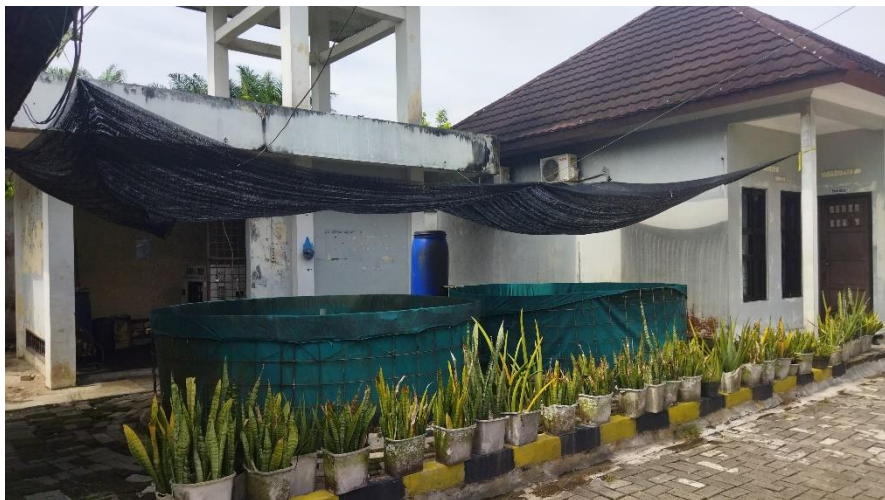
Lampiran 2. 9 Kolam Ikan Lele