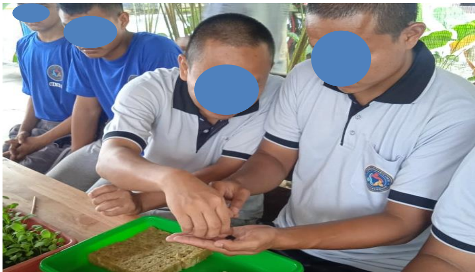
Lampiran 2. 6 Penyemaian Bibit Hidroponik