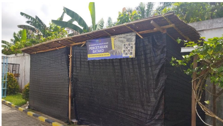
Lampiran 2. 12 Rumah Produksi Batu Batako