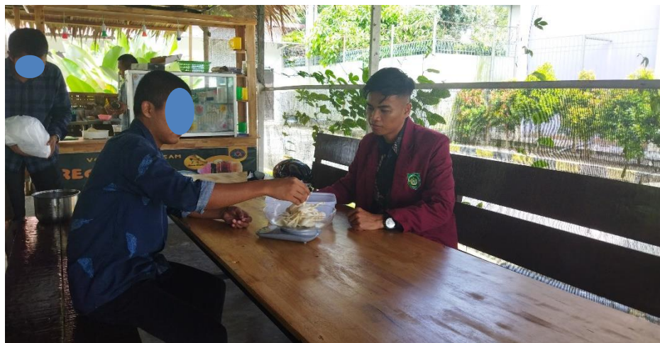
Lampiran 2. 7 Penimbangan Jamur Tiram