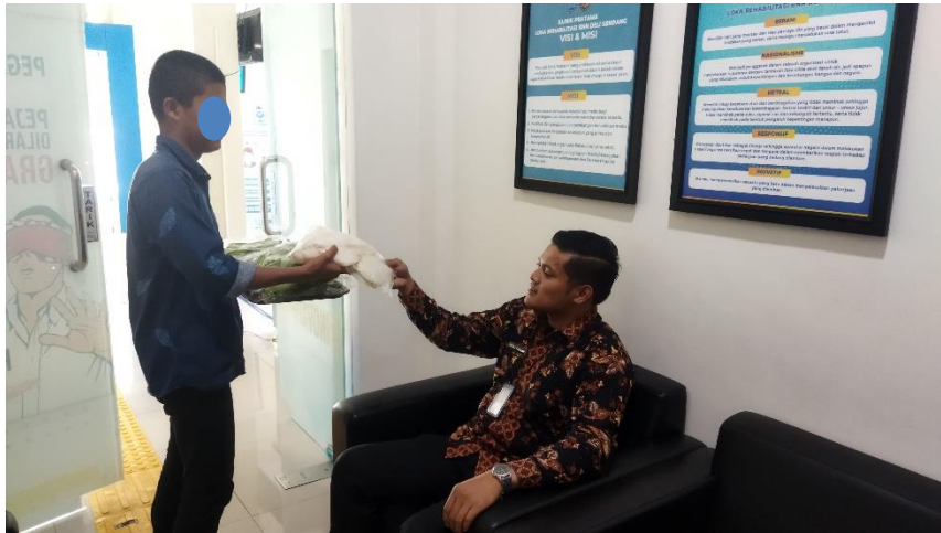
Lampiran 2. 10 Penjualan Jamur Tiram