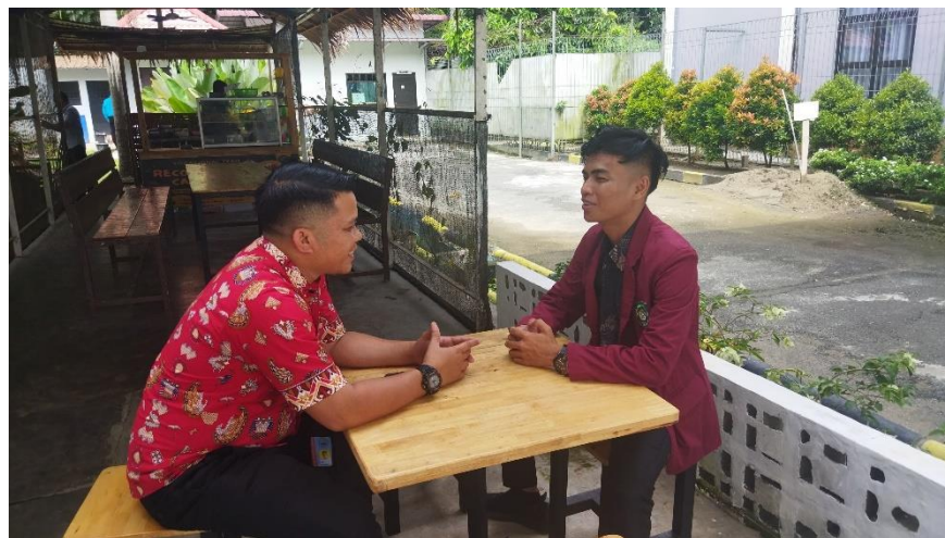
Lampiran 2. 3 Wawancara Fasilitator/Pelatih