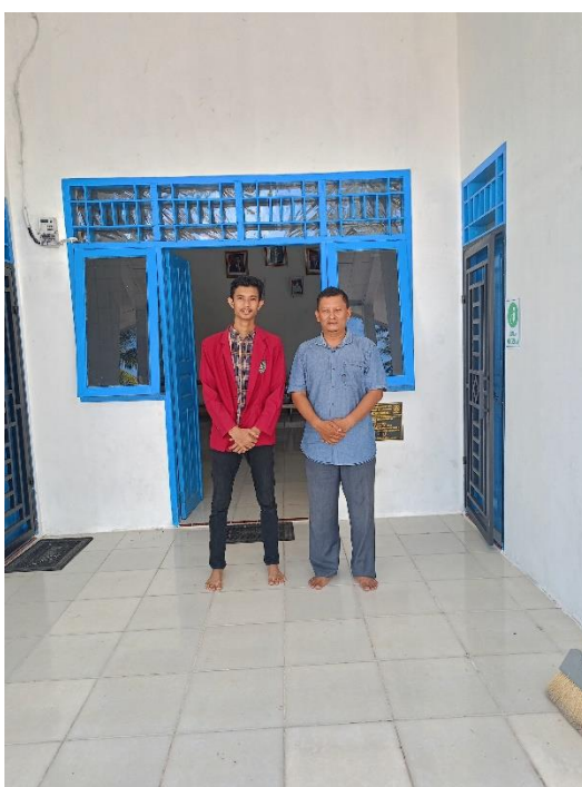
Lampiran 3 Dokumentasi Bersama Perangkat Desa