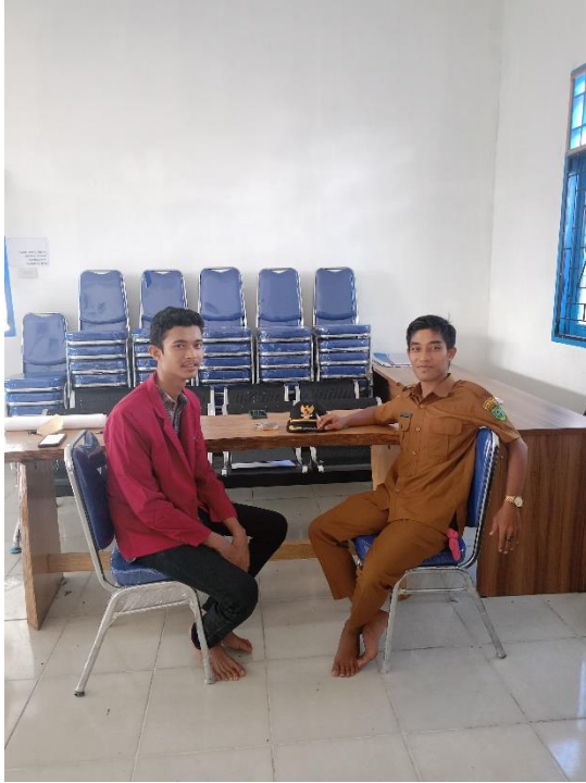
Lampiran 4 Dokumentasi Bersama Kepala Desa