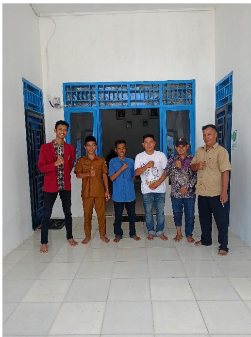
Lampiran 2 Dokumentasi Bersama Perangkat Desa